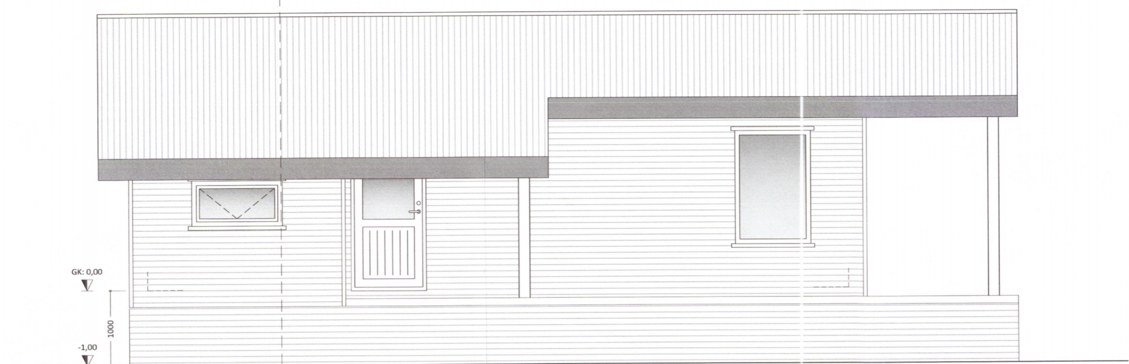
HLIÐ - 1