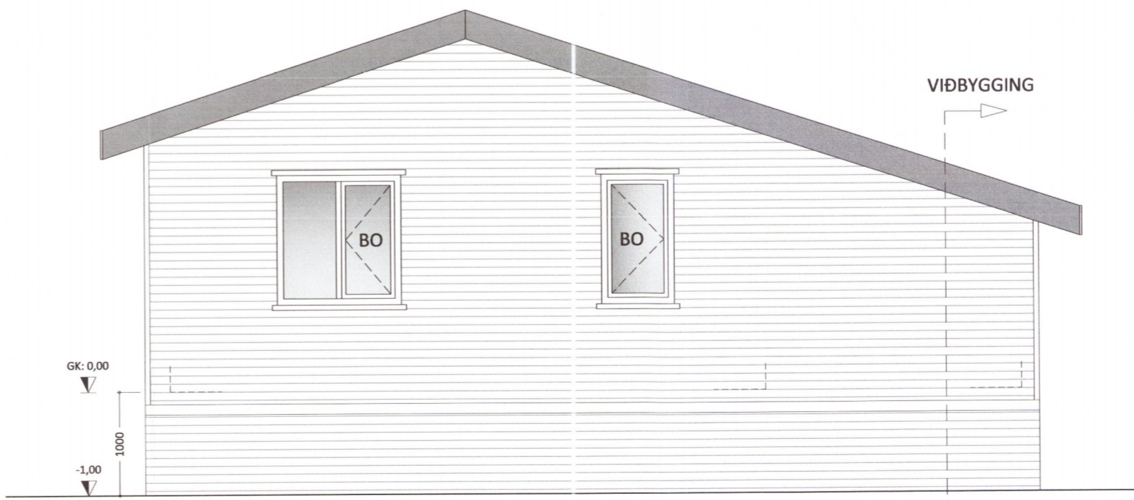
HLIÐ - 4