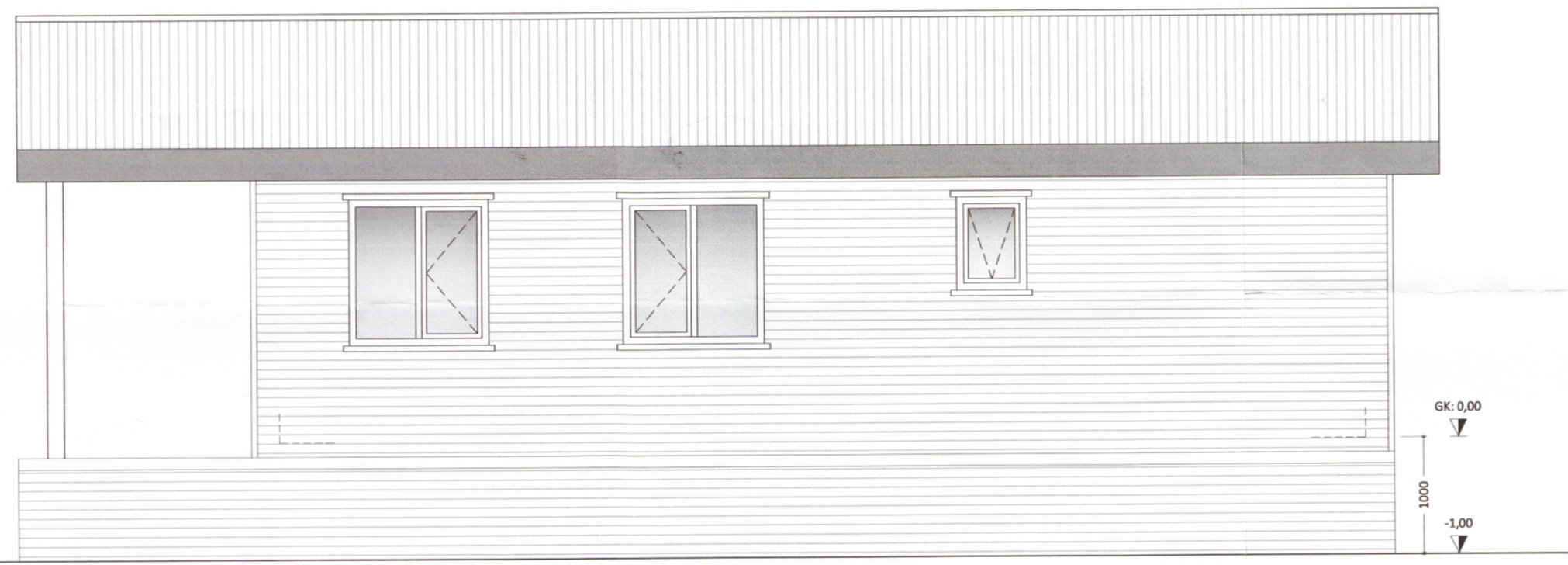
HLIÐ - 3