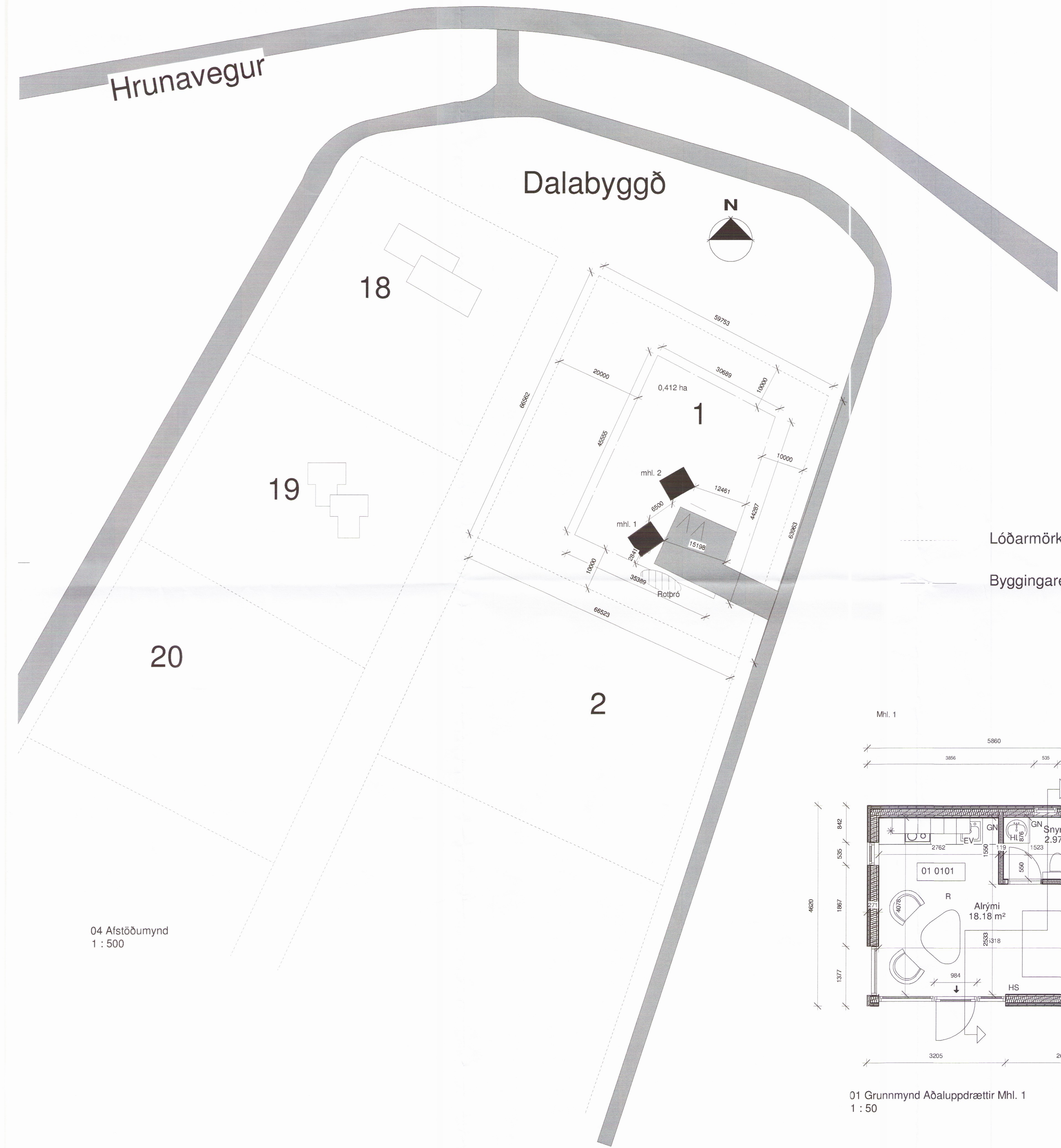
04 Afstöðumynd 1 : 500