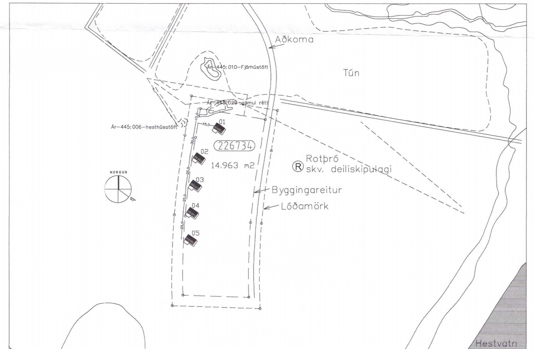
AFSTÖÐUMYND M.K. 1/2000

Brunavarnir og öryggi: Björgunarpopp [BO] er á herbergi (ljósmál 600x1100mm). Koma skal fyrir reykskynjara [R] og handsökkvitæki [S] (ABC duft 6 kg) í húsinu. Sjúkrakassi skal vera í húsinu. Útíljós er við inngang.