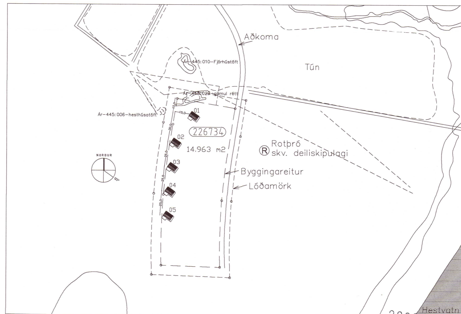
AFSTÖÐUMYND M.K. 1/2000

Brunavarnir og öryggi: Björgunarpíp [BO] er á herbergi (ljósmáli 600x1100mm). Koma skal fyrir reykskynjara [R] og handslökkvitæki [S] (ABC duft 6 kg) í húsinu. Sjúkrakassi skal vera í húsinu. Útiljós er við inngang.