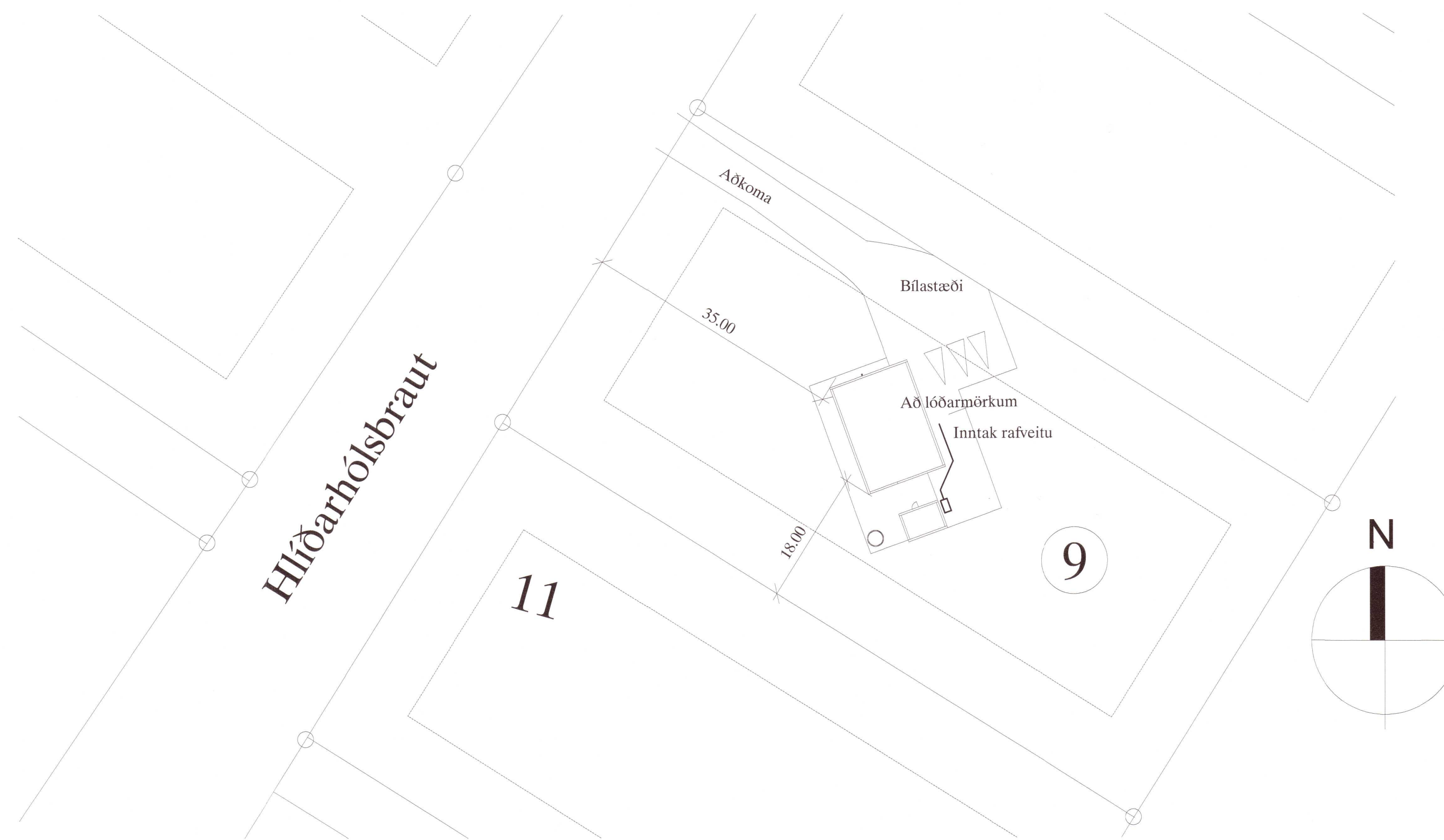
AFSTÖÐUMUMND M. 1:500