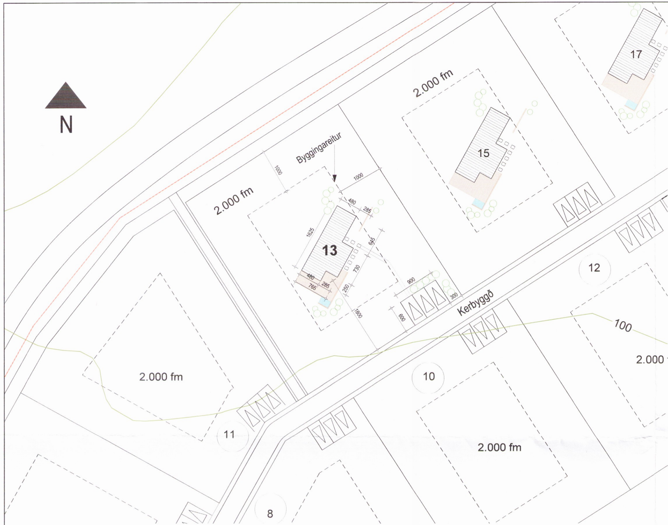
Afstöðumynd 1: 500 Málsetningar eru í cm.