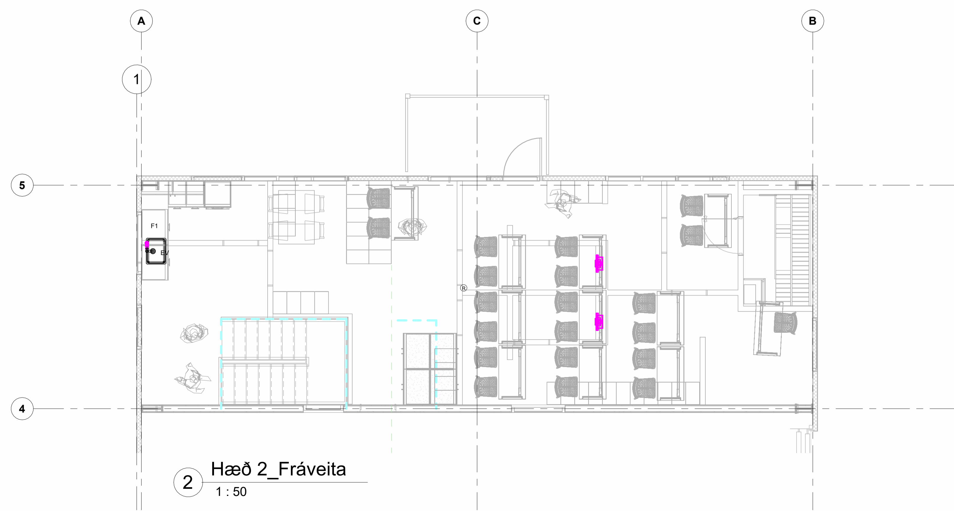
2 Hæð 2_Fráveita 1 : 50