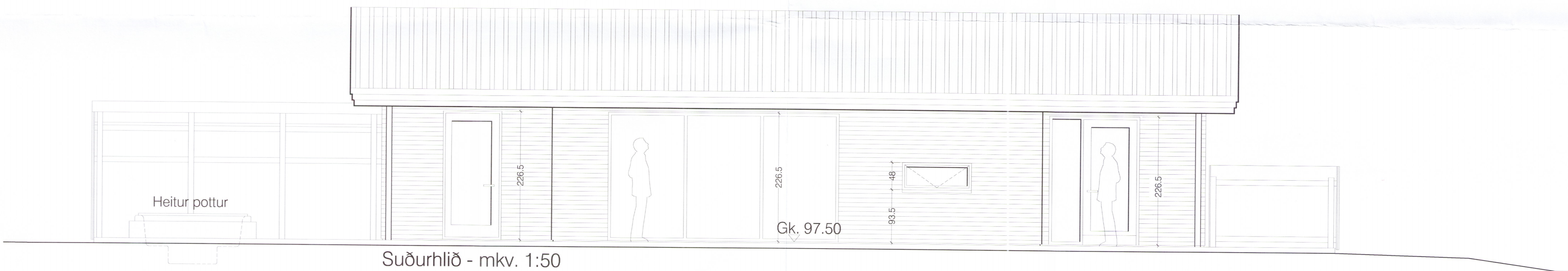
Suðurhlið - mkv. 1:50