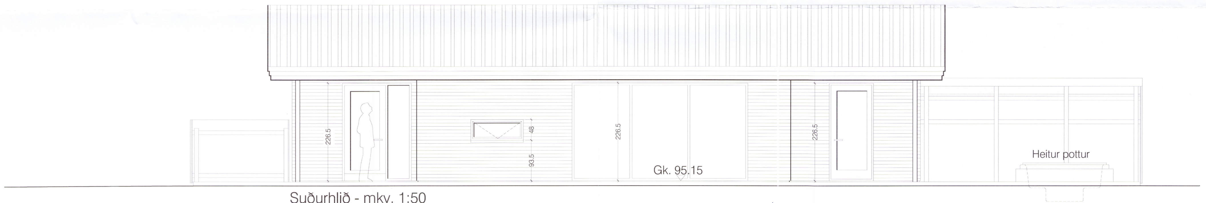
Suðurhlið - mkv. 1:50

3752-14 Mósar 10 einbýlishús í landi Stórafhljóts í Bláskógabyggð