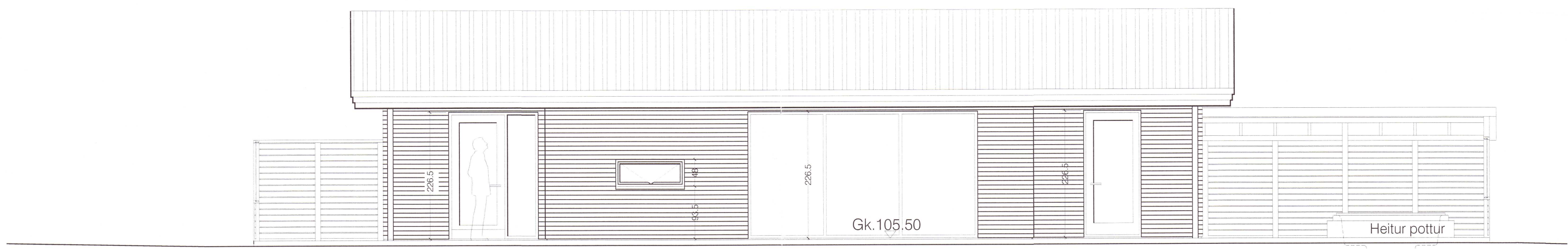
Suðurhlið - mkv. 1:50