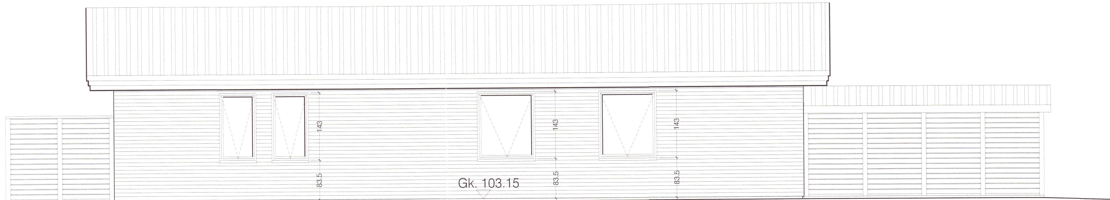
Norðurhlið - mkv. 1:50