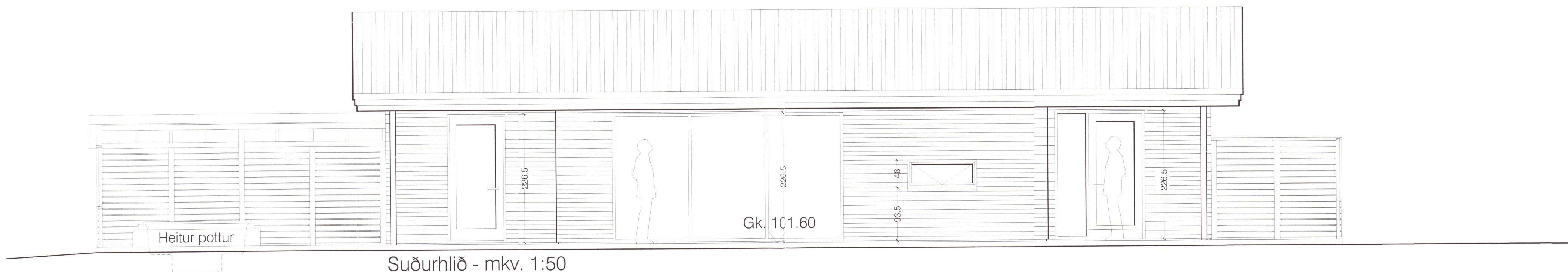
Suðurhlið - mkv. 1:50