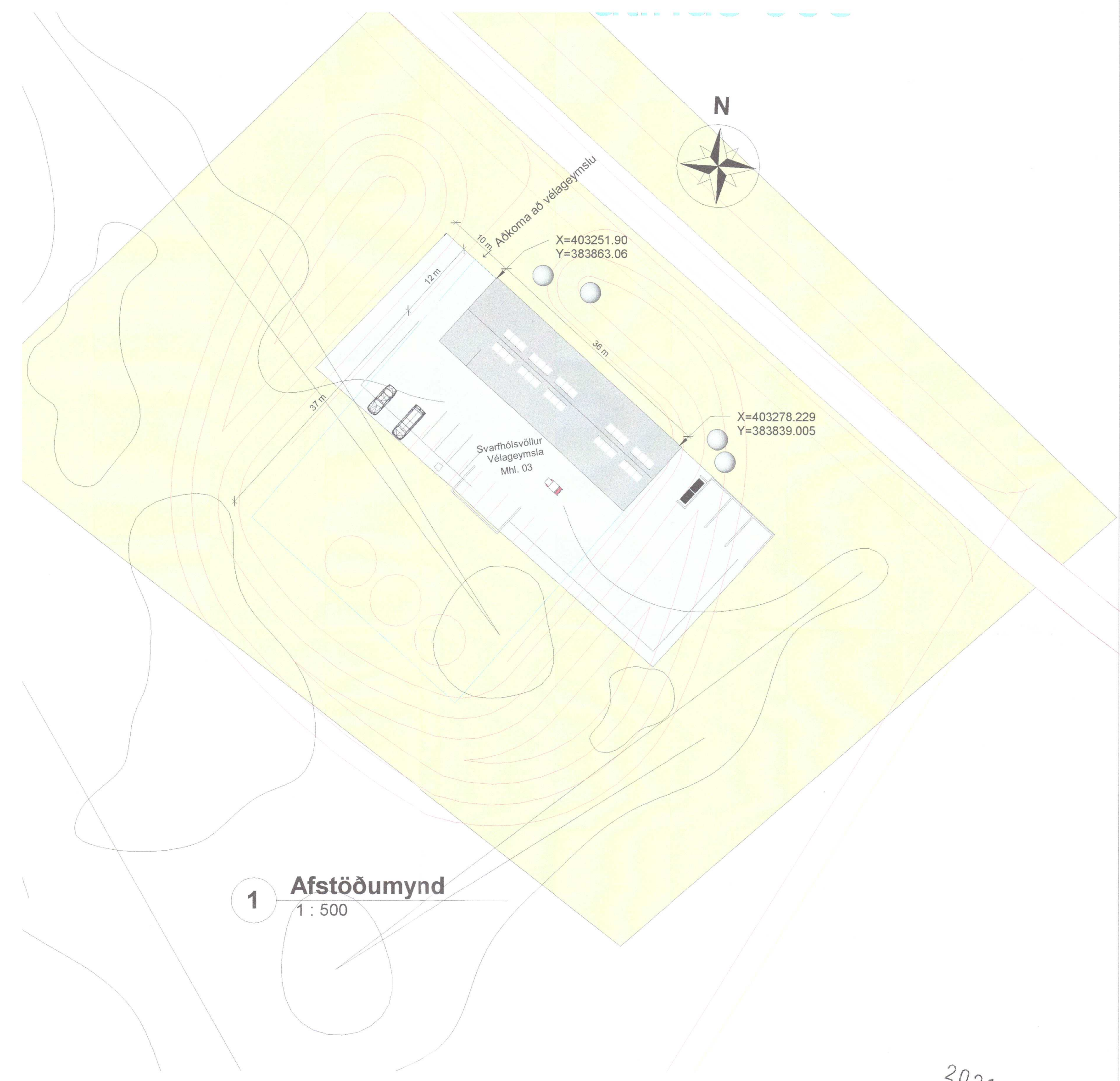
1 Afstöðumynd 1 : 500