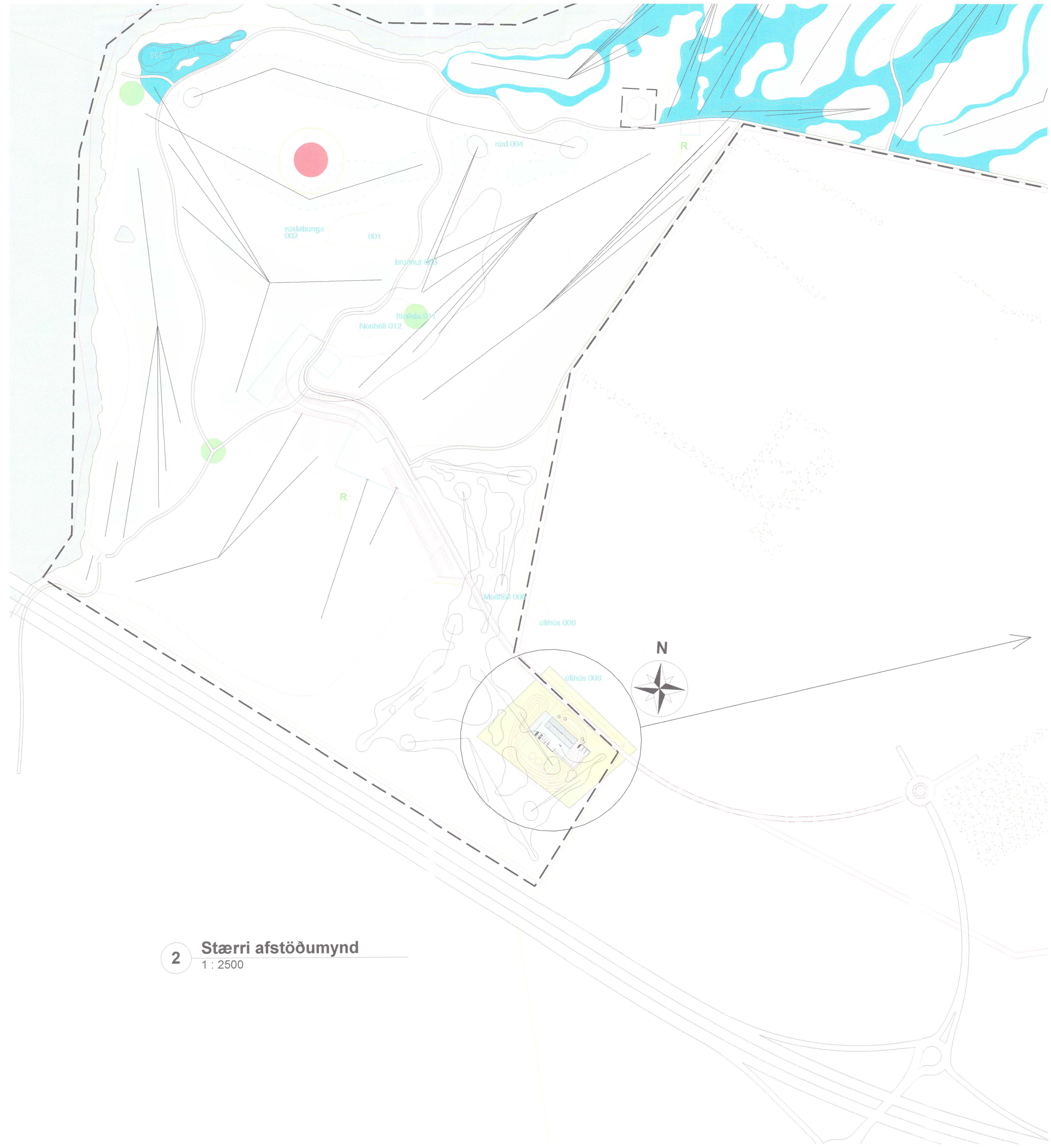
2 Stærri afstöðumynd 1 : 2500