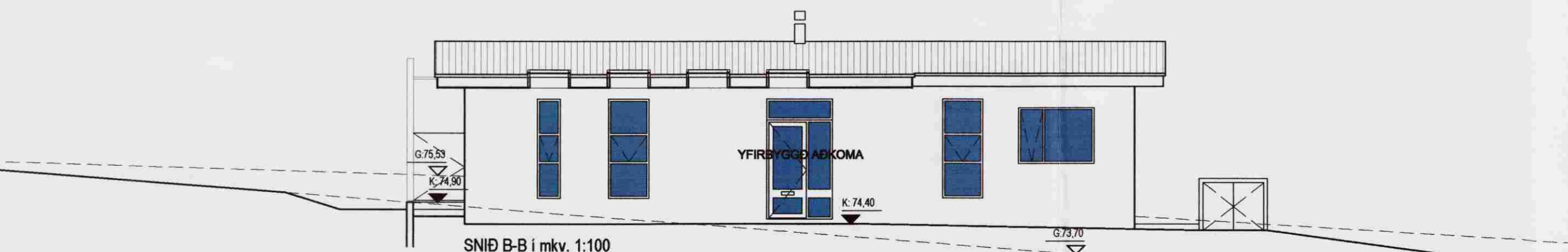
SNID B-B í mkv. 1:100

Gólfefni 130 mm staðsteypt plata m/gólfhitagögn 100 mm einangrun