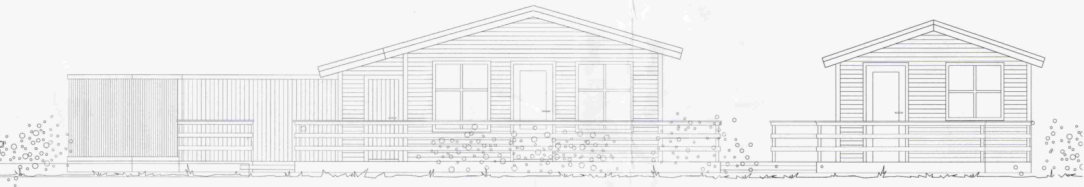
ÁSÝND SUÐUR 1:50