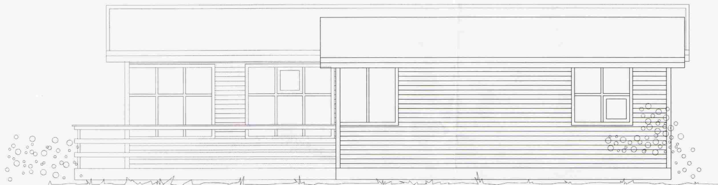
ÁSÝND AUSTUR 1:50

Hildigunnur Sværisdóttir Byggingafræðingur / MAA, Árnessýslu og Flóahar.