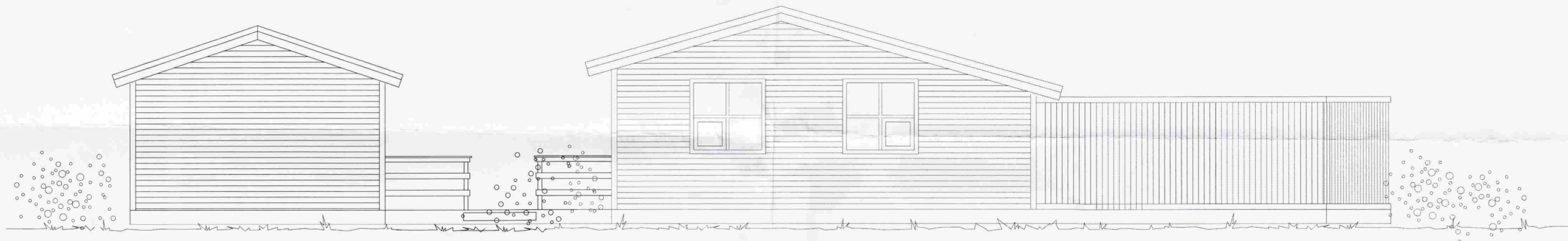
ÁSÝND NORÐUR 1:50