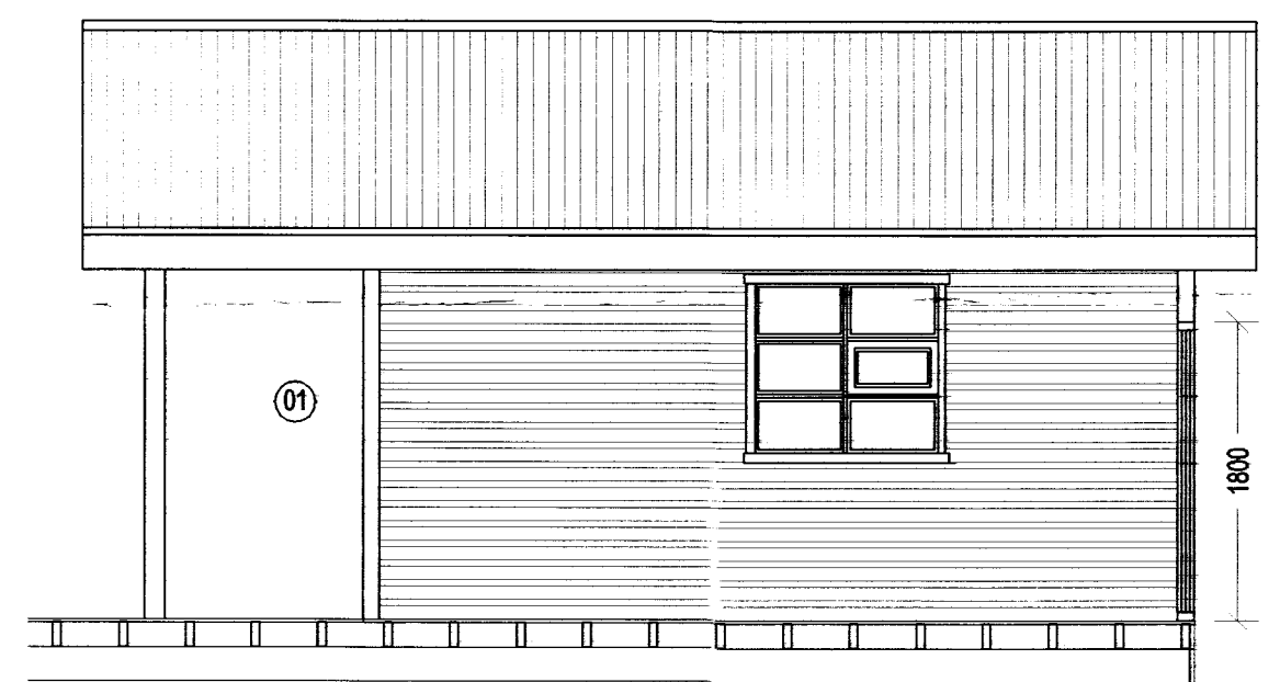
SNIÐ B - B, Mkv. 1:50