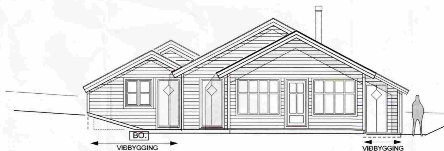
Suðlæg hlið 1 : 100