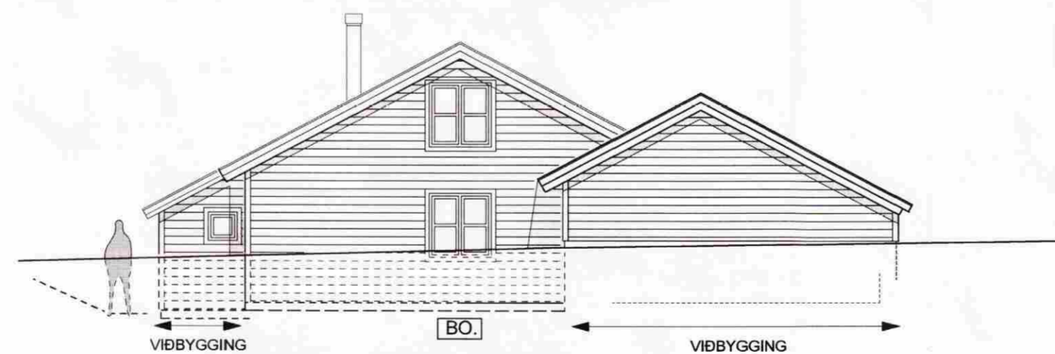
Suðlæg hlið 1 : 100