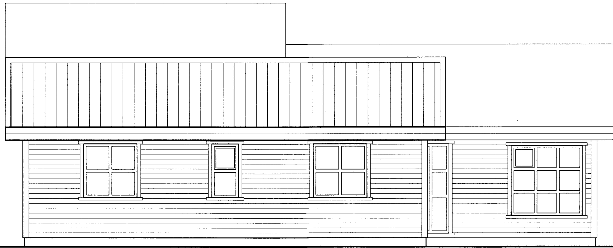
ÚTLIT NORÐLÆG HLIÐ