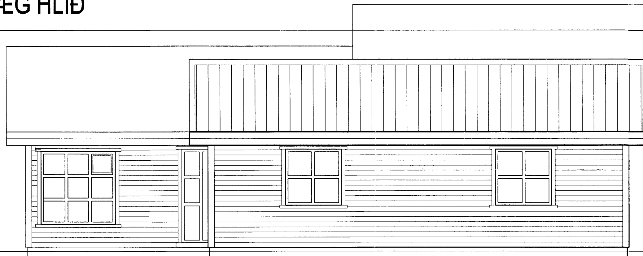
ÚTLIT SUÐLÆG HLIÐ