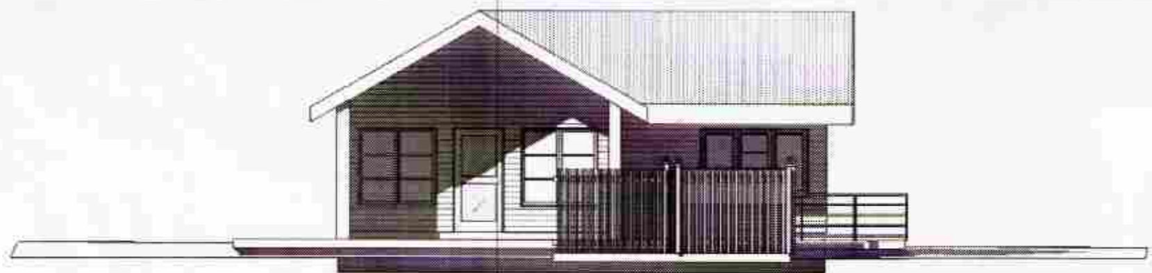
3 Suður 1 : 100