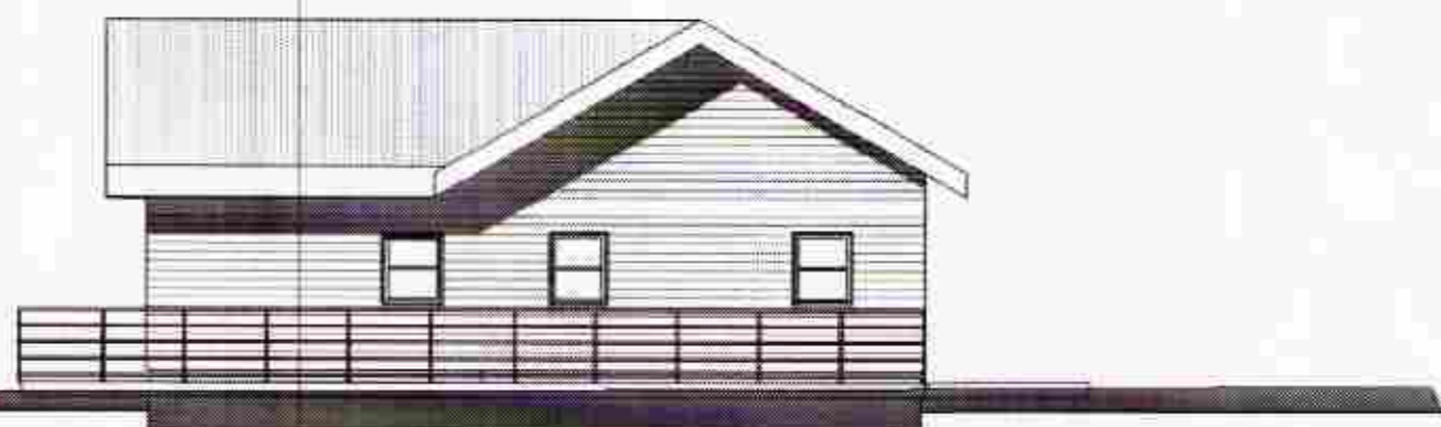
2 Norður 1 : 100