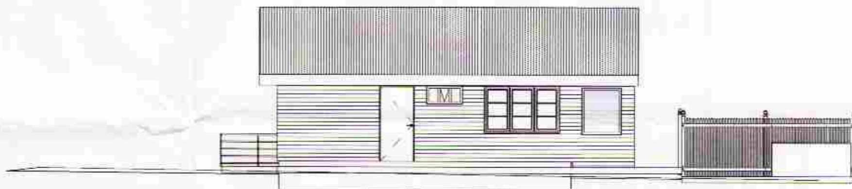
4 Vestur 1 : 100