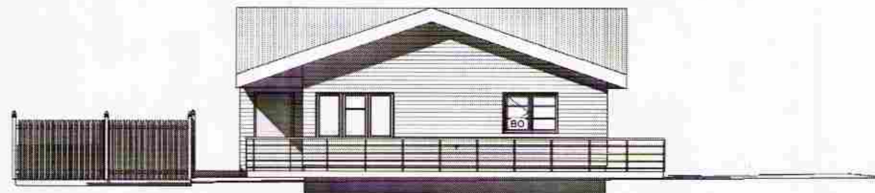
1 Austur 1 : 100

SAMÞYKKT 30 MAJ 2012 Helgi Hjálmarsson Byggingalutfrú uppv. Ámessjalu og Flóahf.