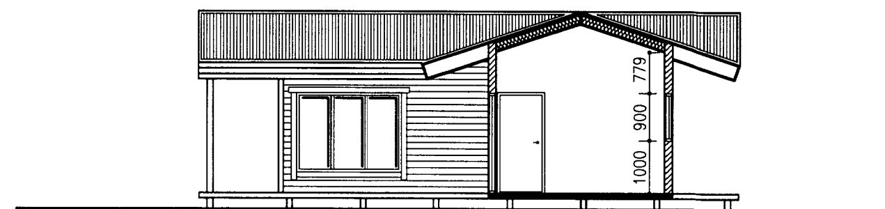
SNID 2-2 1:100