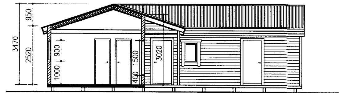
SNID 1-1 1:100