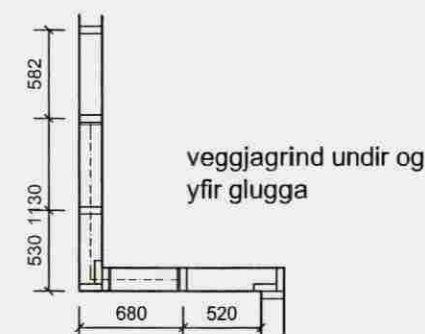
grunnmynd - veggjagrindur 1:50