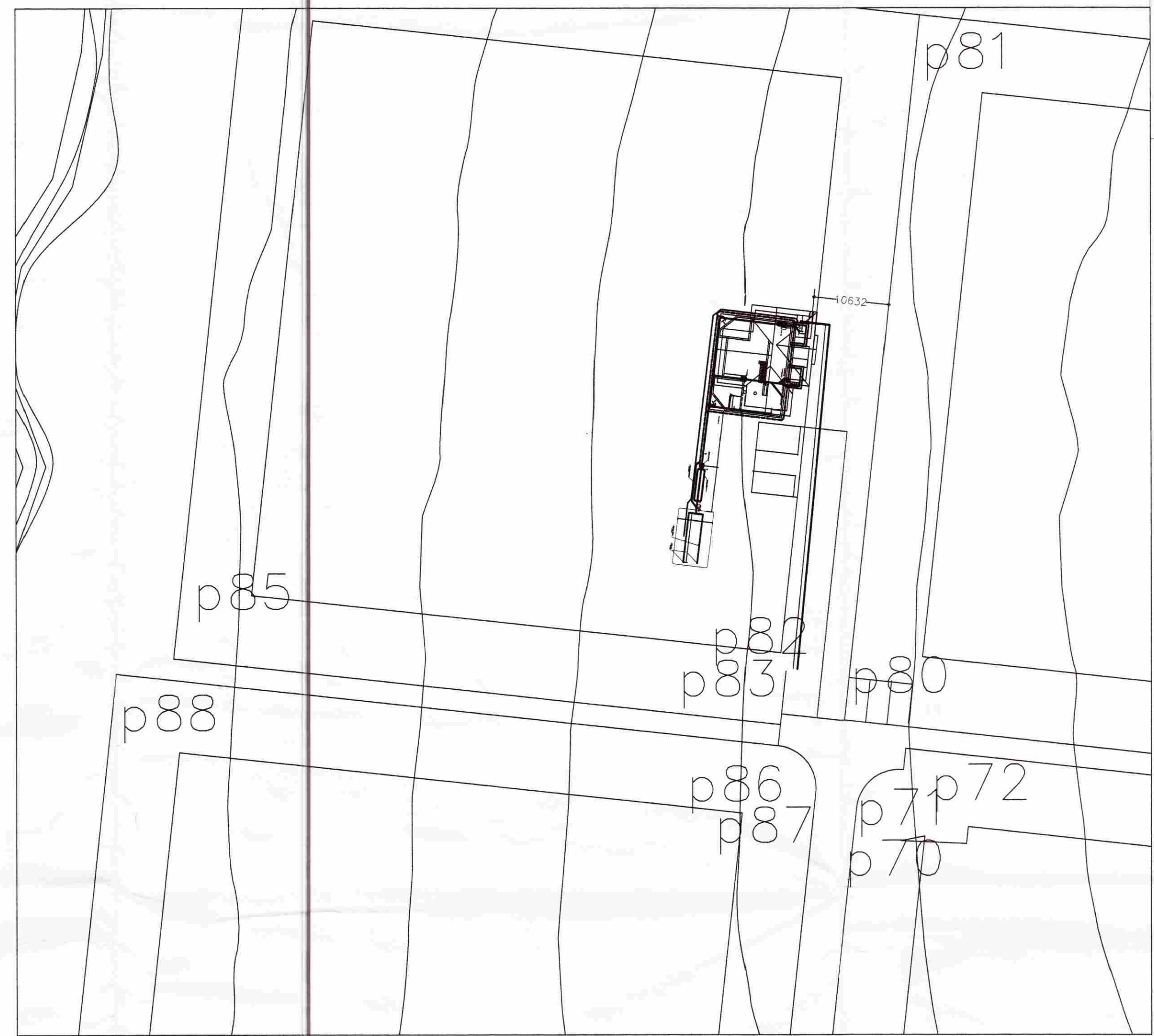
Afstöðumynd Mkv. 1:500.