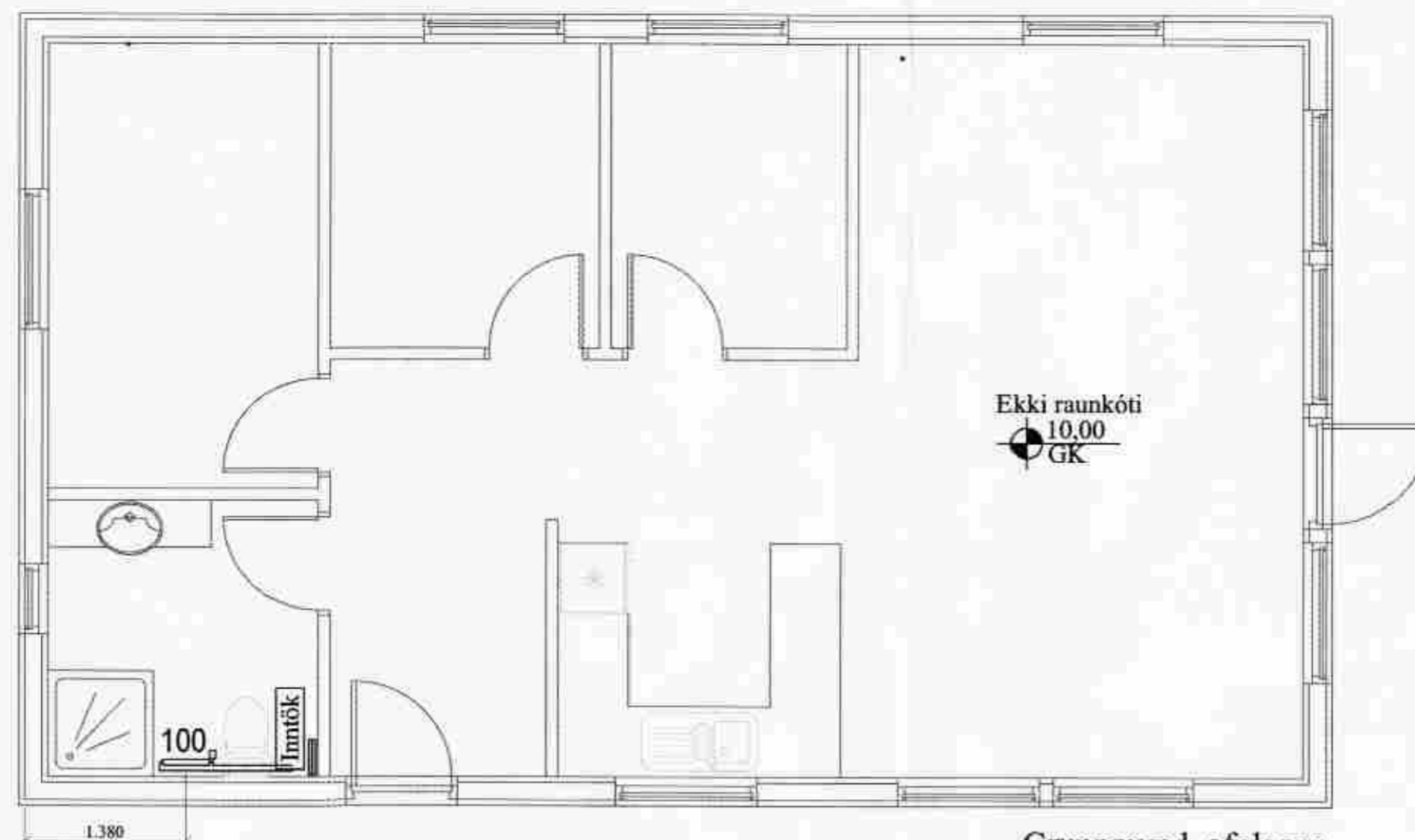
Grunnmynd ofnlagna mkv. 1:50