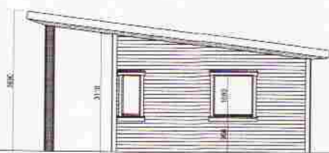
Gesthús útlit Vestur 1:100