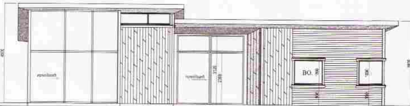
Útlit Suður 1:100