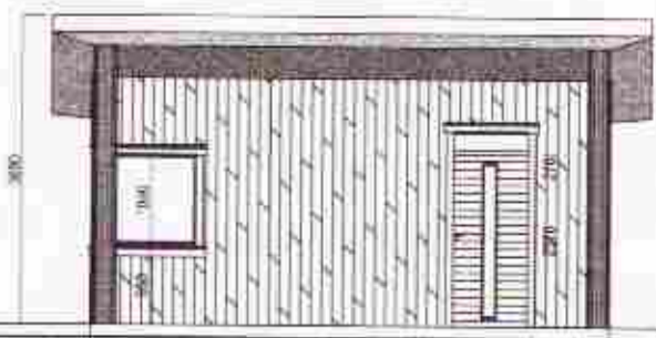
Gesthús útlit Suður 1:100

Verk: Dynjandavegur 18, Spóastöðum Teikning: Útlit Verkaupi: Pílot ehf. máttkvarði: 1:100 / 1:500 teiknað: GBS & HS dagsetning: nóvember 2006