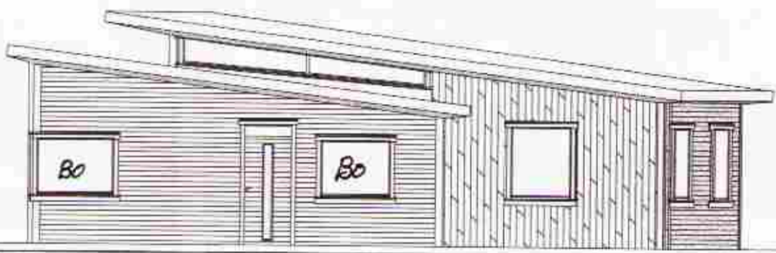
Útlit Vestur 1:100