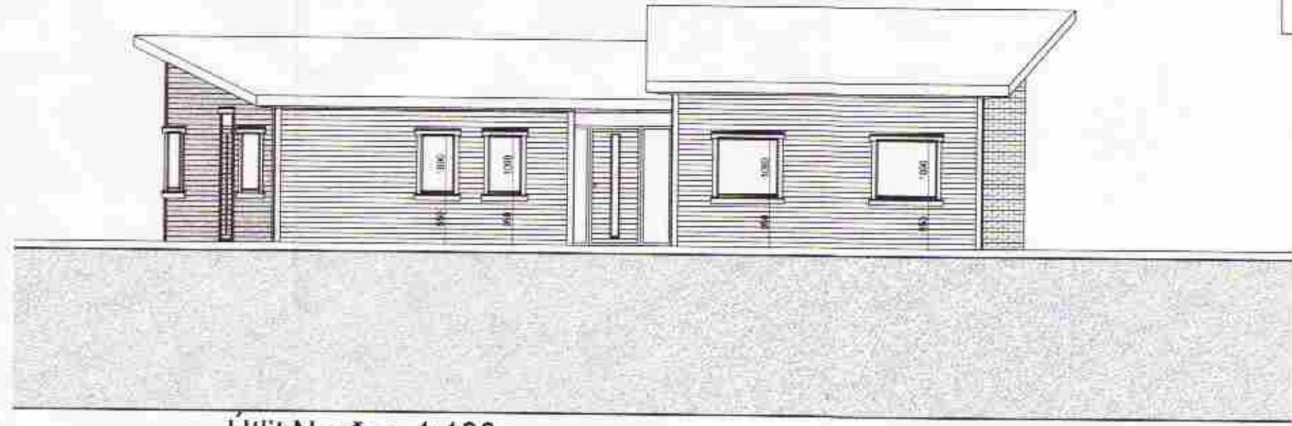
Útlit Norður 1:100