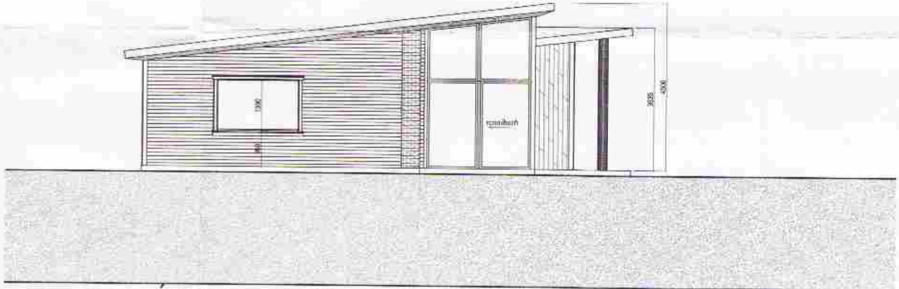
Útlit Austur 1:100

Verk: Dynjandavegur 18, Spóastöðum Teikning: Útlit Verkaupi: Pílot ehf. máttkvarði: 1:100 / 1:500 teiknað: GBS & HS dagsetning: nóvember 2006