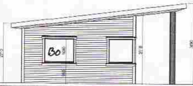
Gesthús útlit Austur 1:100