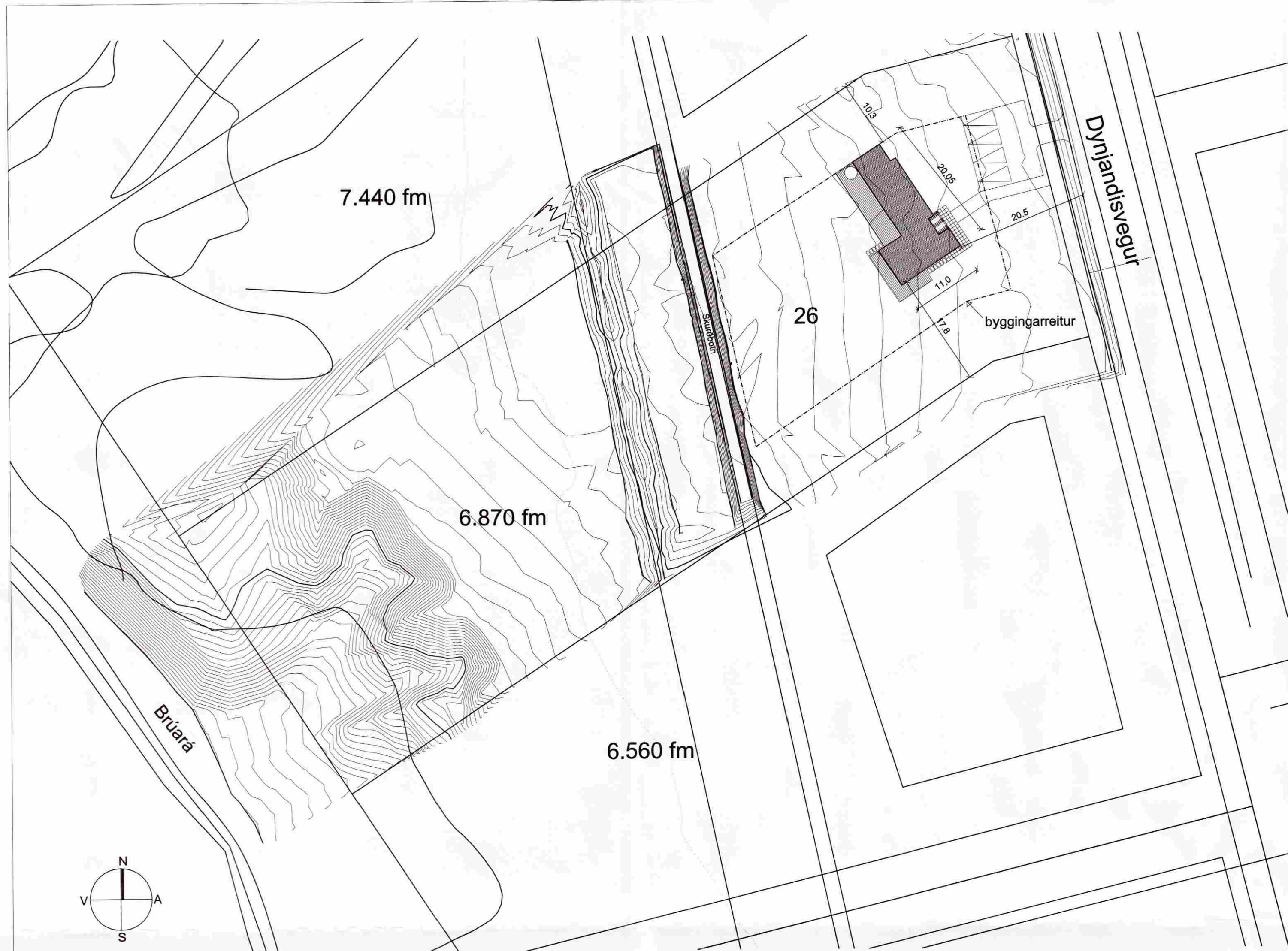
Afstöðumynd M 1:500