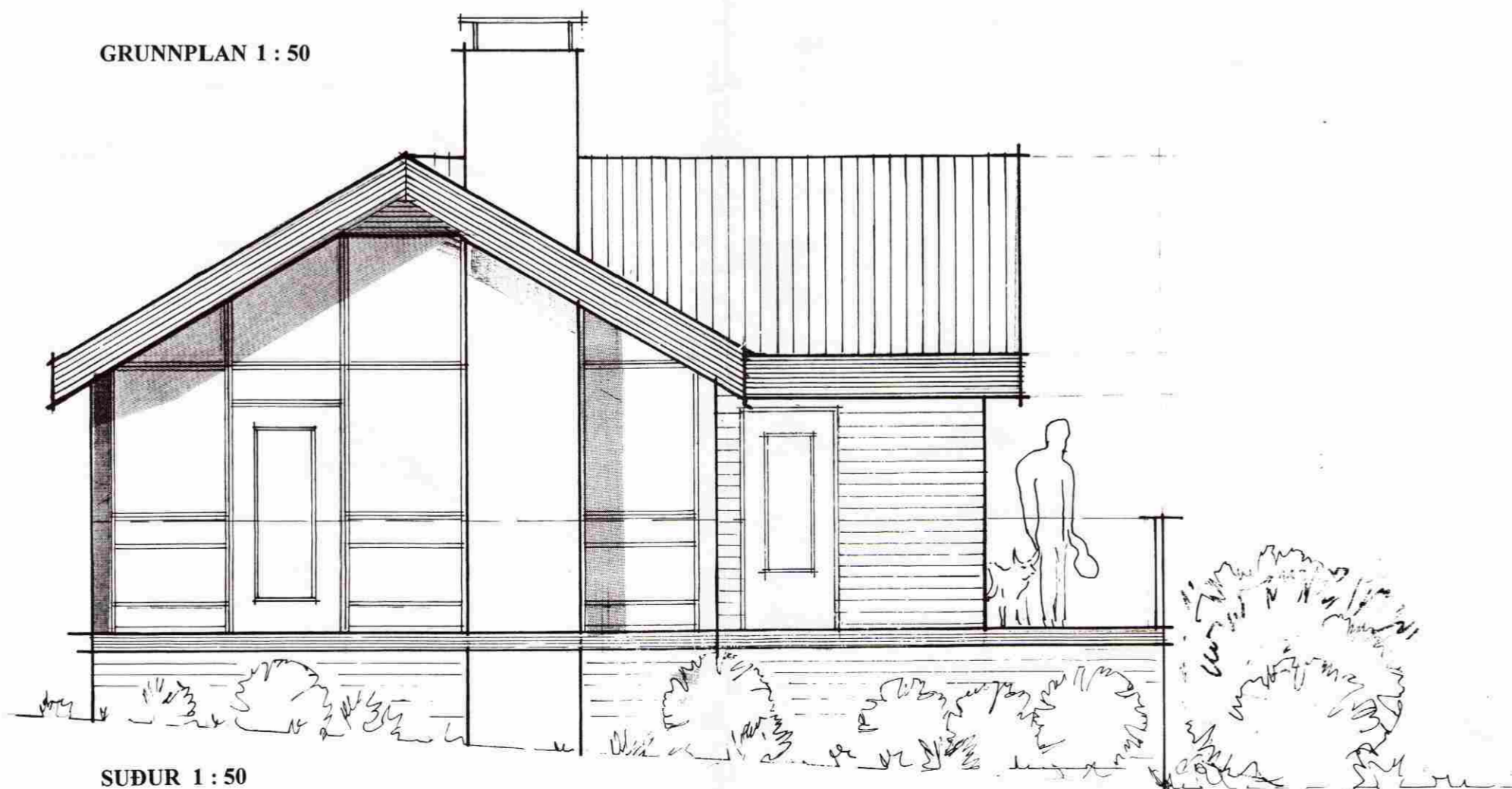
SUÐUR 1 : 50