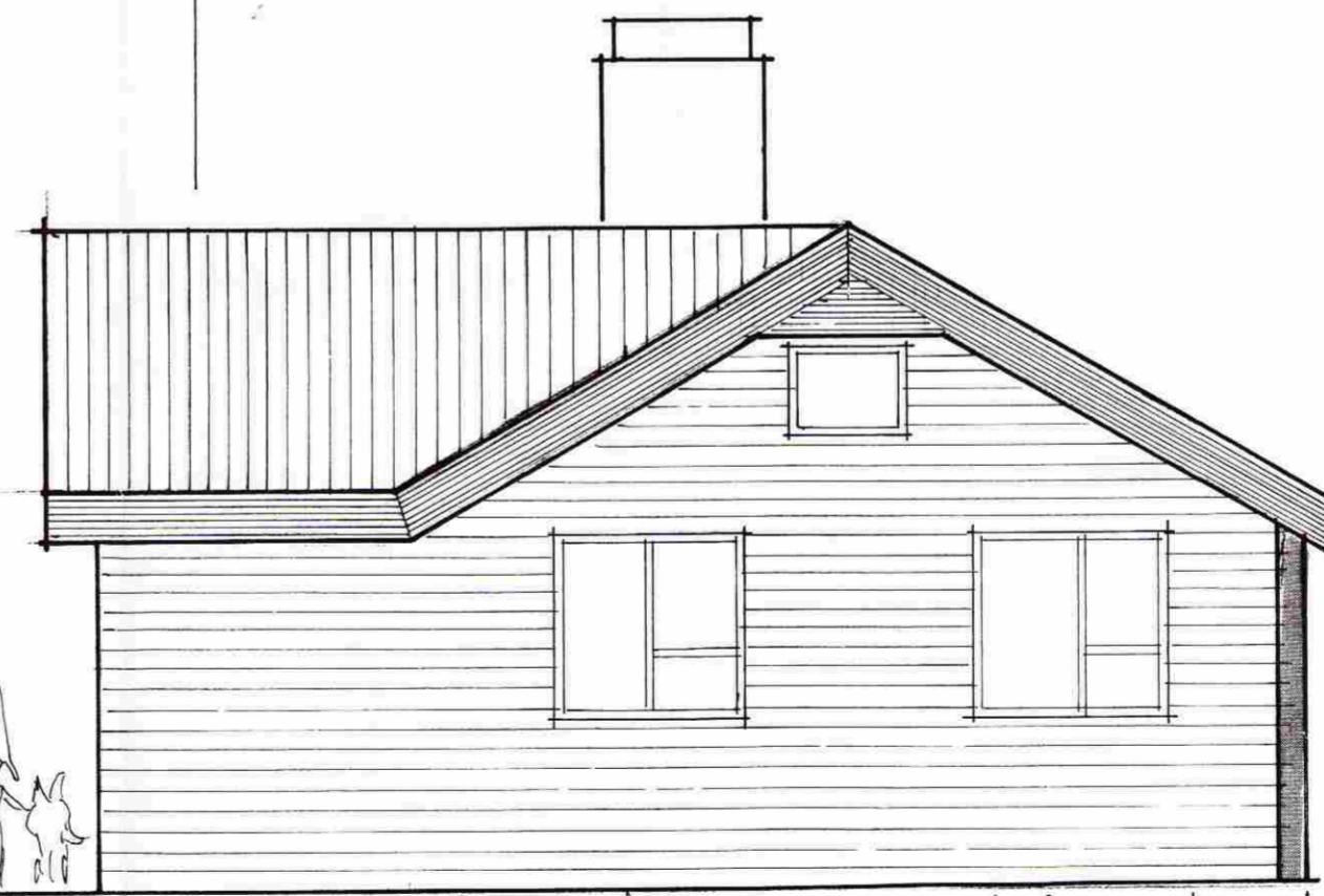
NORÐUR 1 : 50