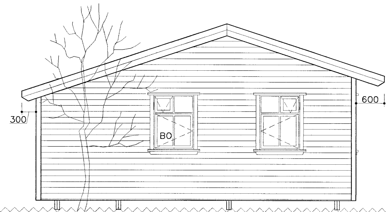
ÚTLIT GAFL / PALLUR 1:50 Tegund 6087