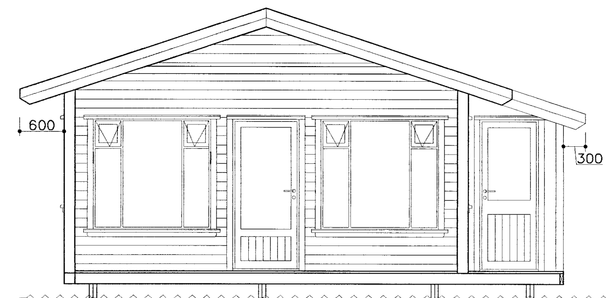
ÚTLIT GAFL / PALLUR 1:50 Tegund 6087

Höfundaréttur.: Ólafur U. Jónhannsson kt.;181059-3709