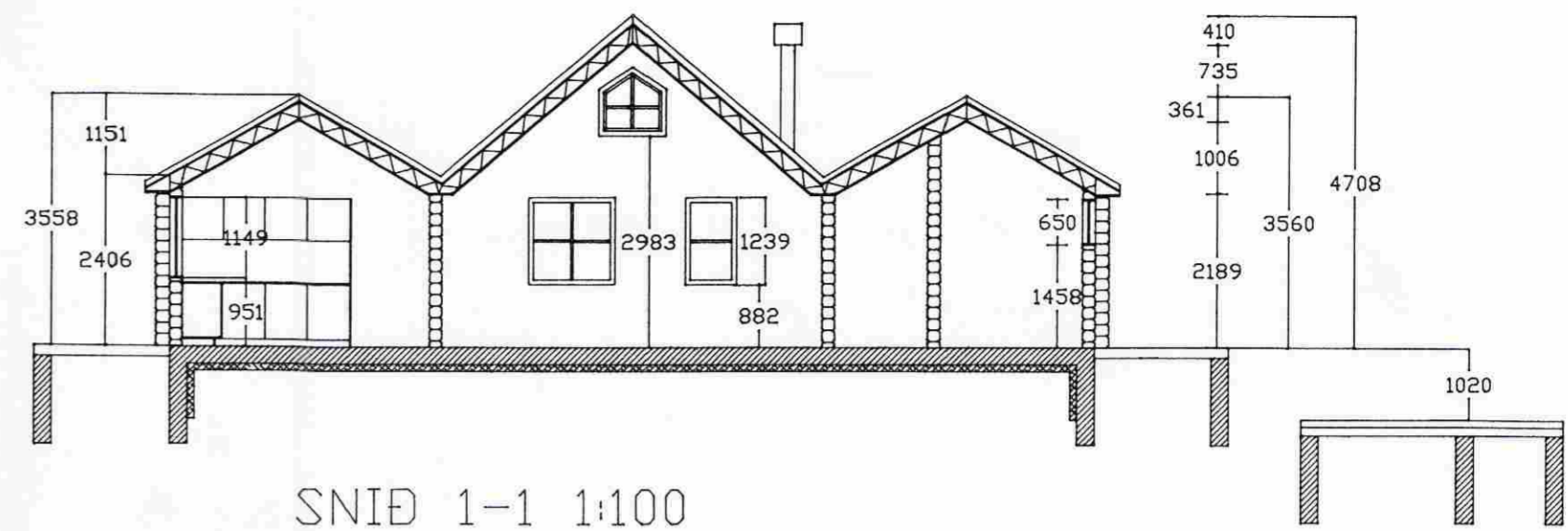
SNID 1-1 1:100

Samykktt 28 FEB. 2006 Byggingartulltrúi uppsveita Árnessýslu