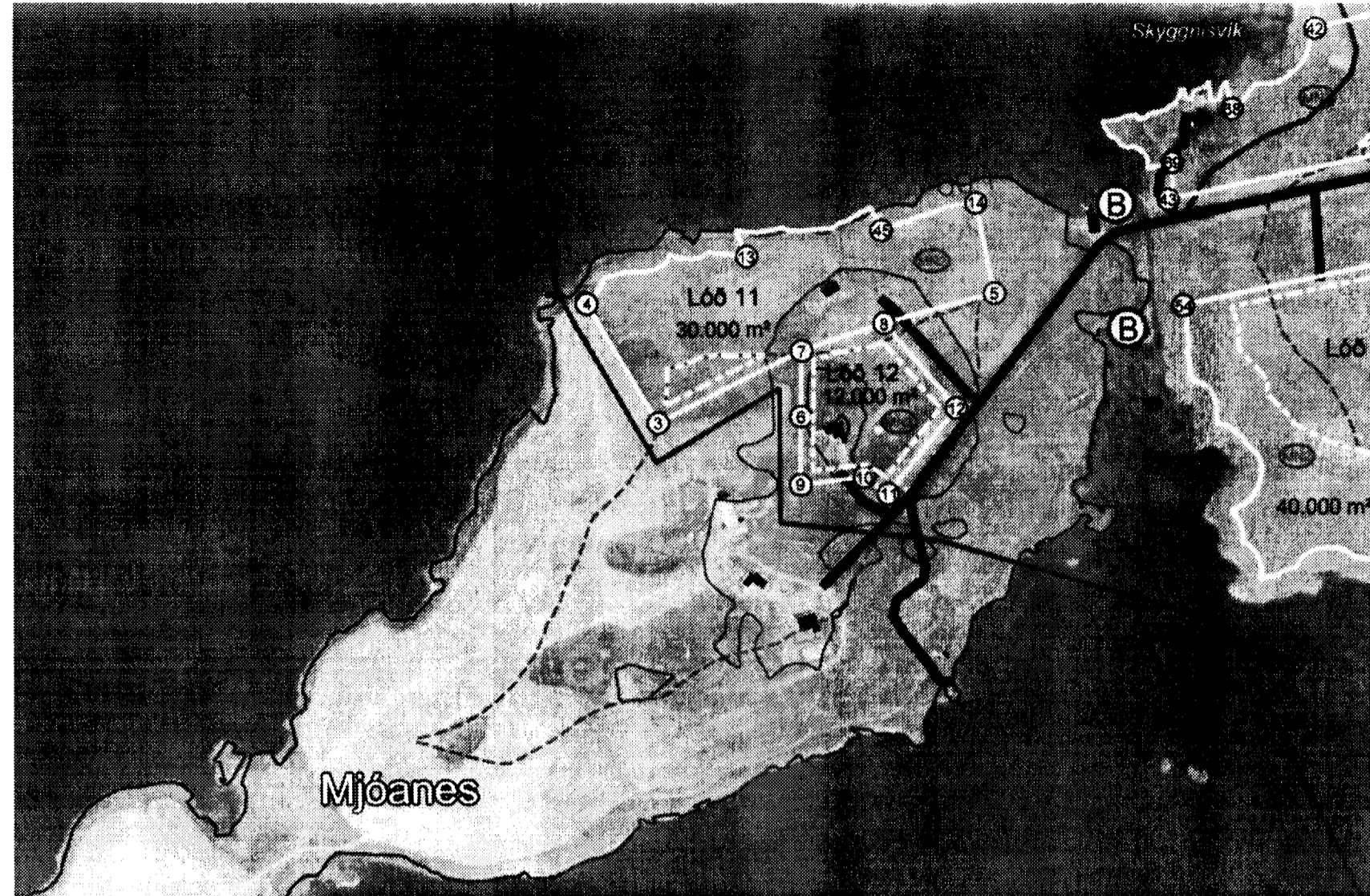
Afstöðumynd, mkv. 1:5000