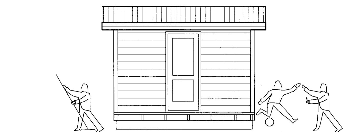
GEYMSLA VESTUR MKV.1: 50