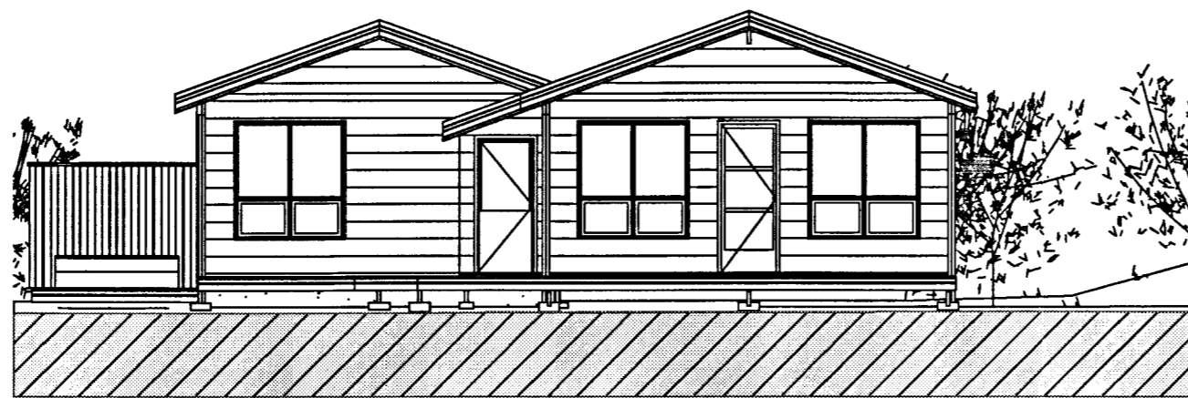
3 SUDLÆG ÁSÝND 1:100