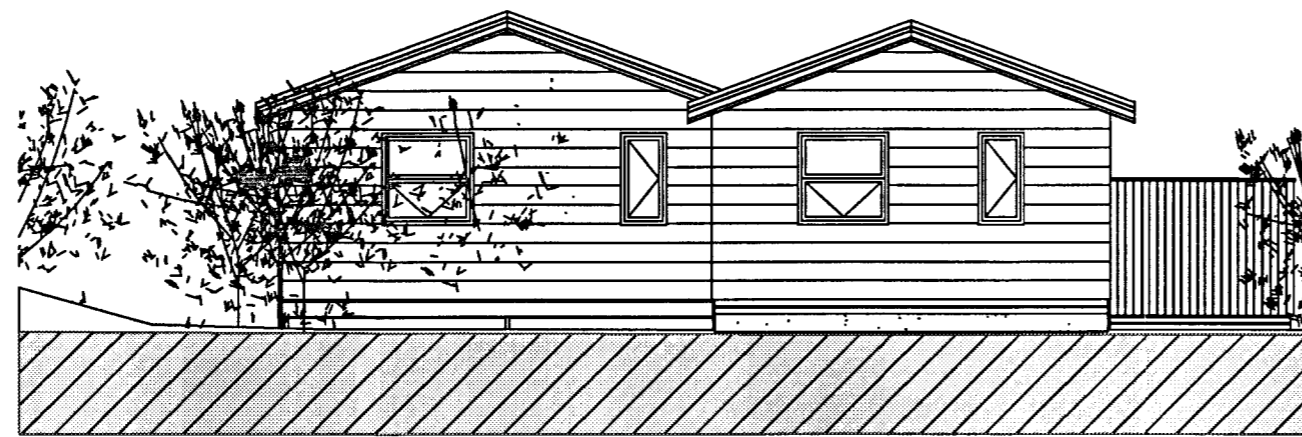
1 NORDLÆG ÁSÝND 1:100