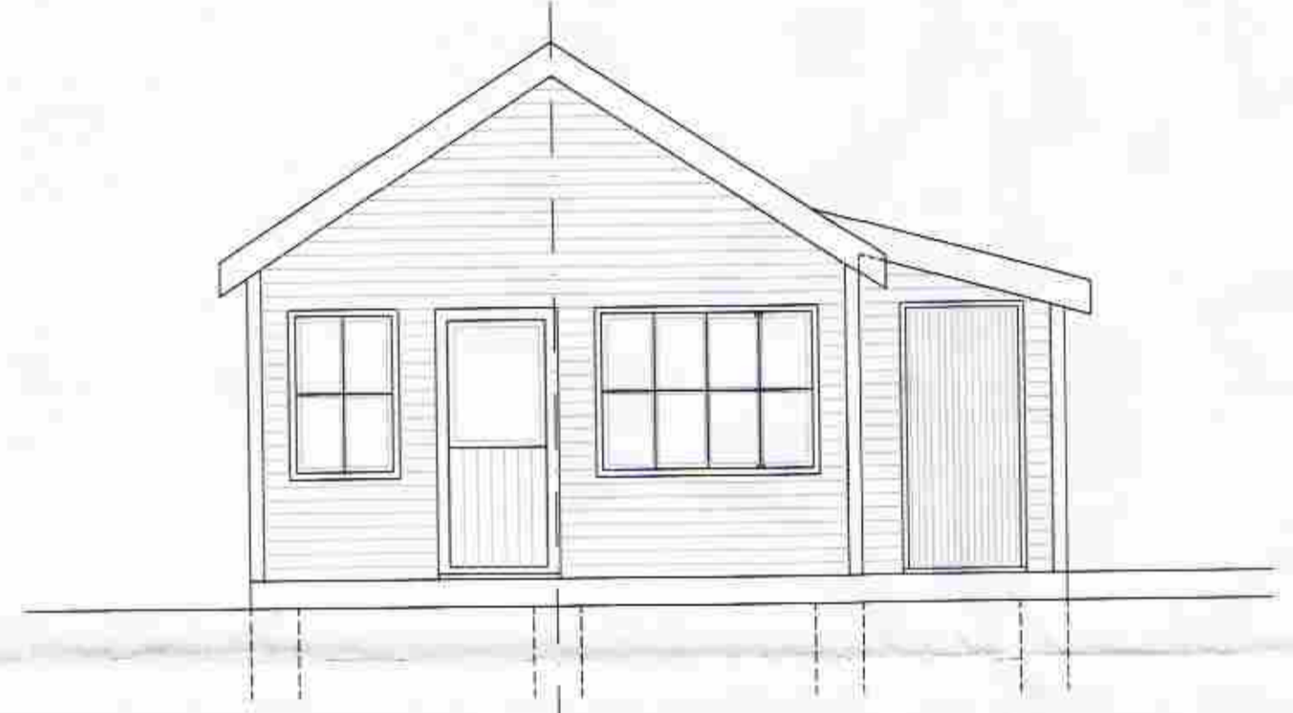
ÚTLIT VESTUR M. 1:50