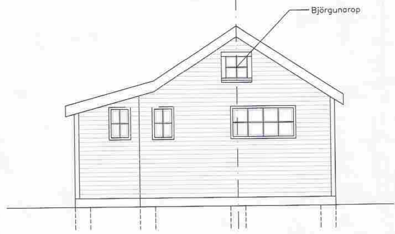
ÚTLIT AUSTUR M. 1:50