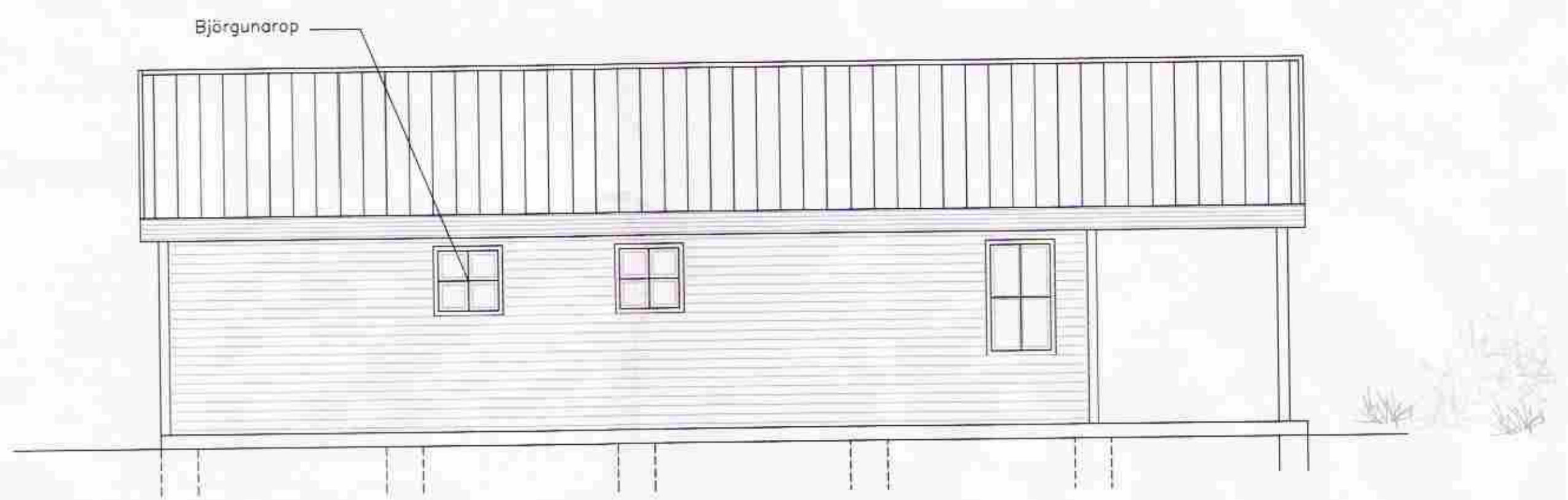
ÚTLIT NORÐUR M. 1:50