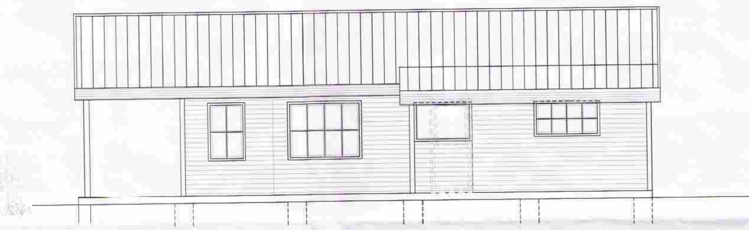
ÚTLIT SUÐUR M. 1:50