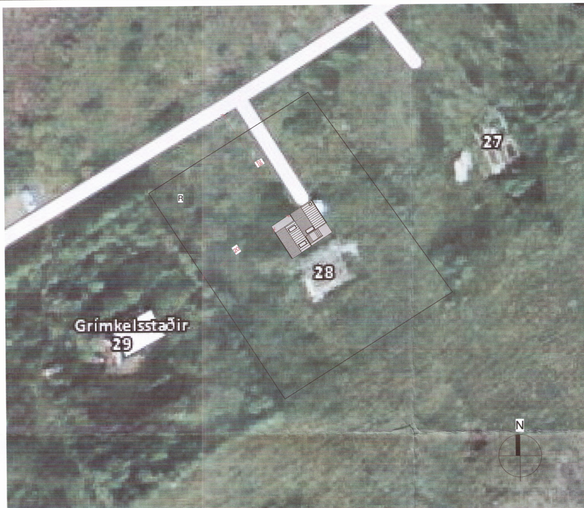
Afstöðumynd 1 : 500