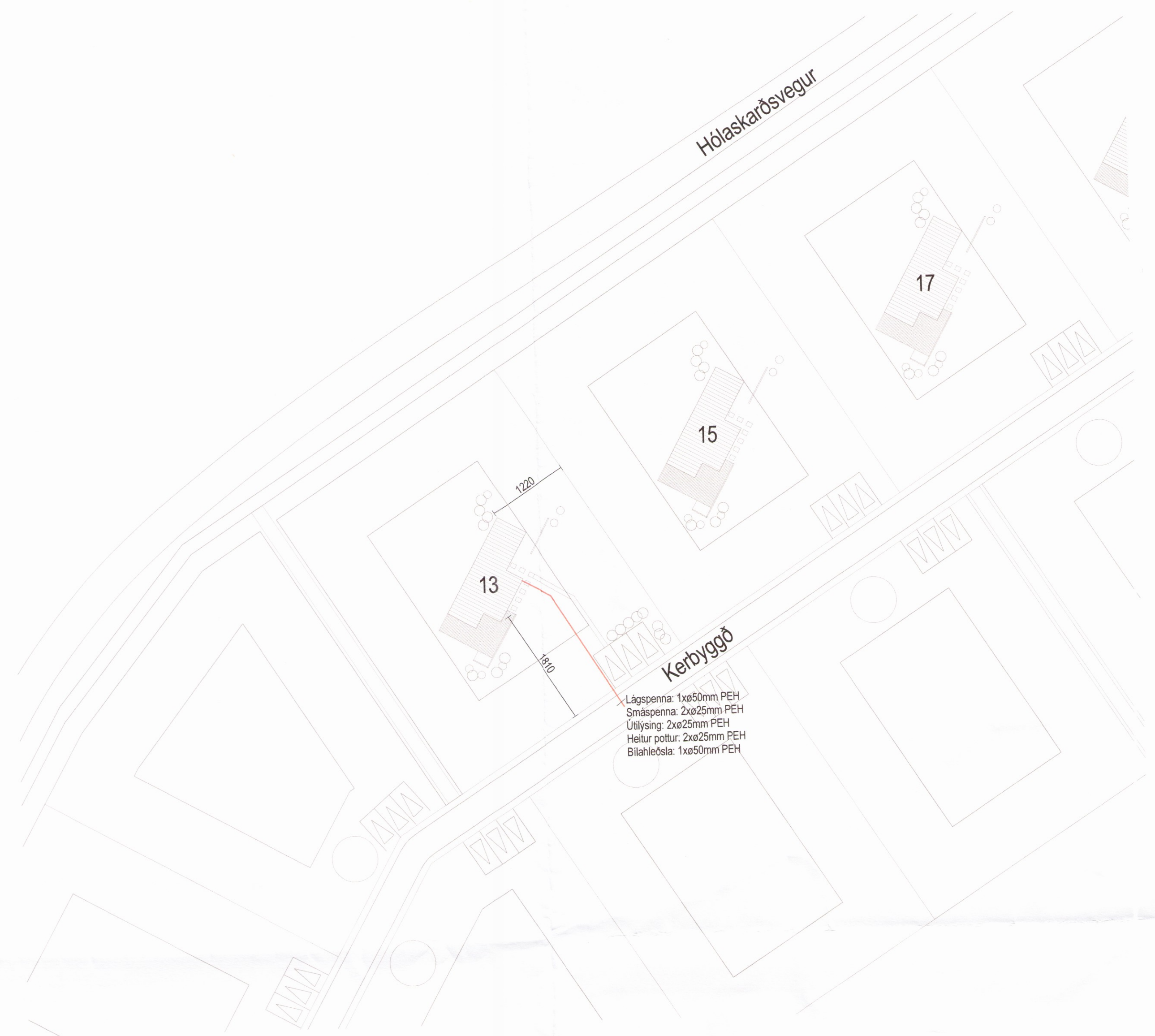
Afstöðumynd - Hús 13 1 : 50