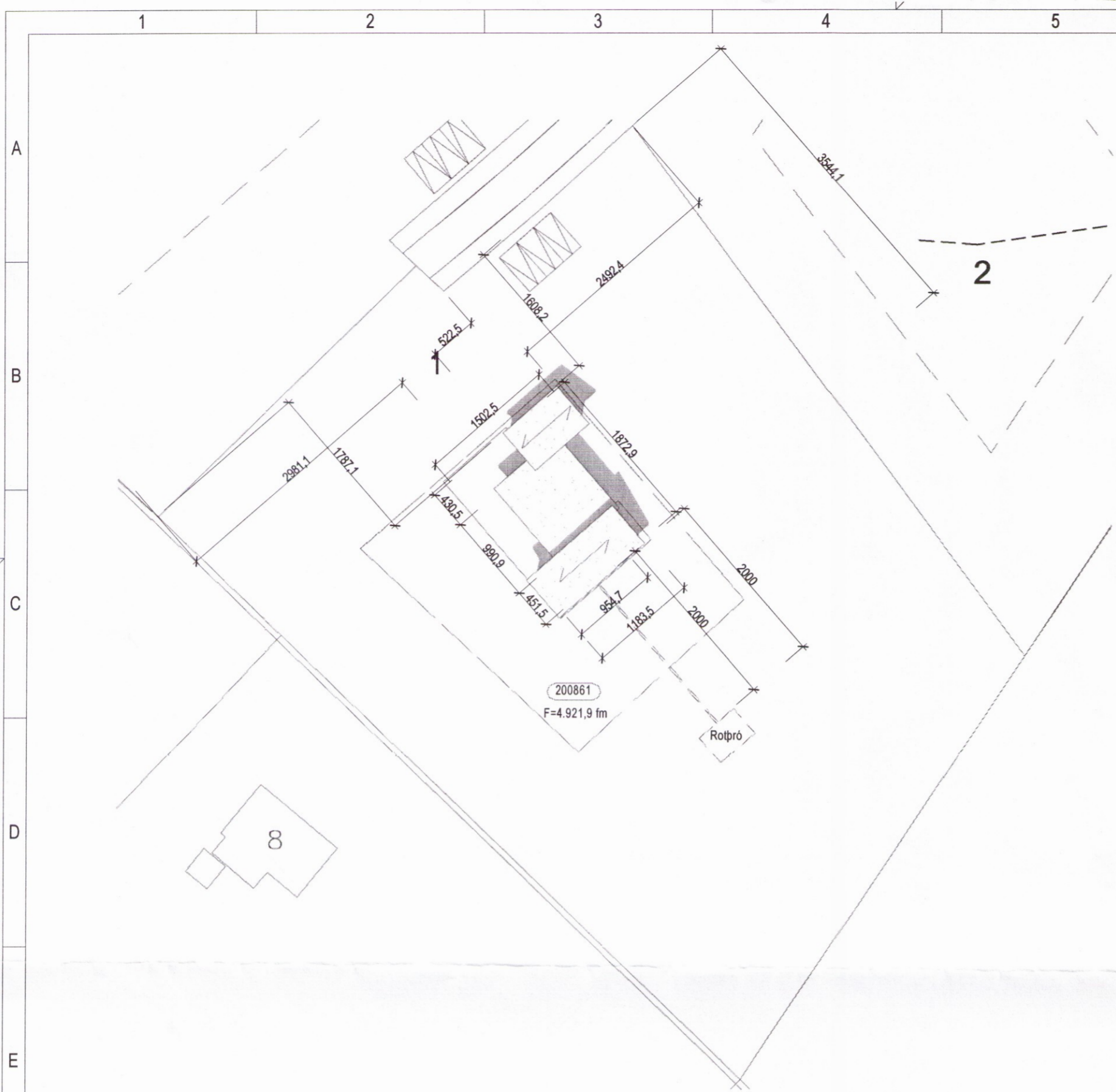
Afstöðumynd 1 : 500