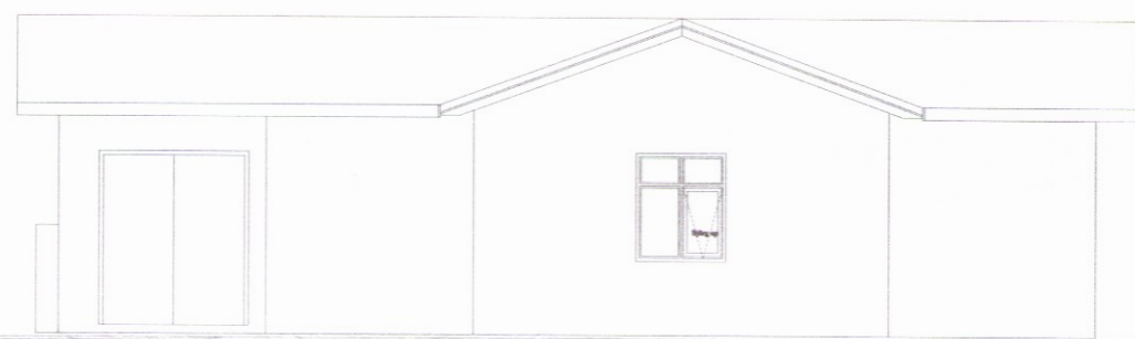
ÚTLIT NORÐURHLIÐAR Mkv: 1/100