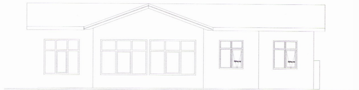
ÚTLIT SUÐURHLIÐAR Mkv: 1/100

SAMPYKKT 06. OKT. 2010 Runólfur Jónsson Byggingatvörfuppsýr, Árnæssýslu og Flóahf.