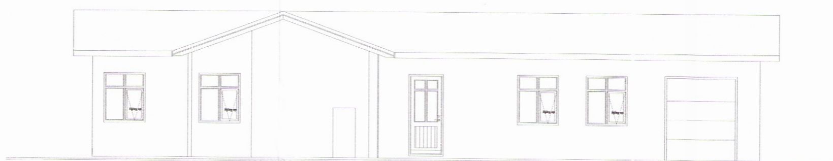
ÚTLIT AUSTURHLIÐAR Mkv: 1/100