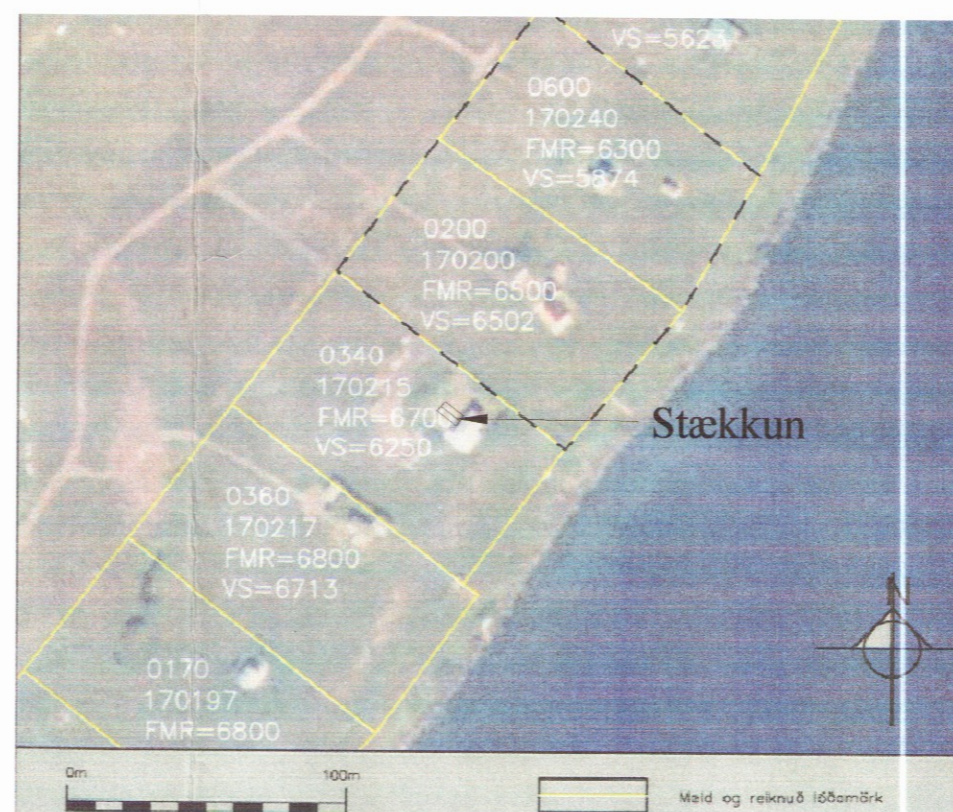
AFSTÖÐUMYND AF SVÆÐINU Mkv: 1/1000