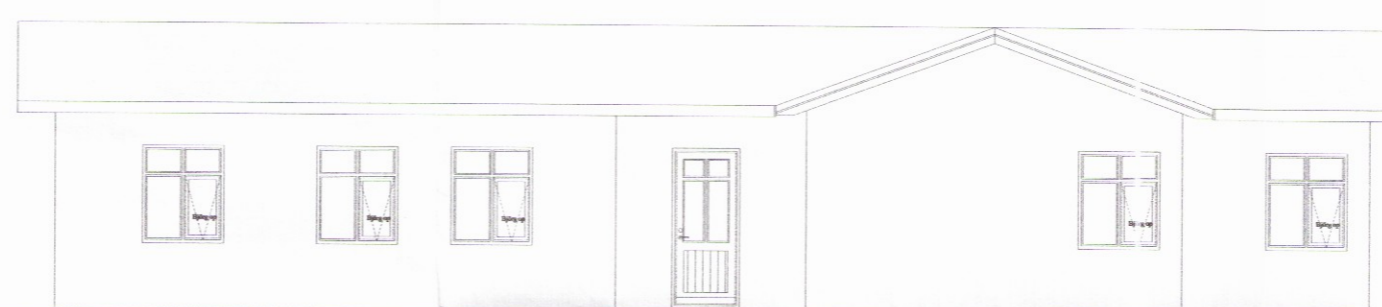
ÚTLIT VESTURHLIÐAR Mkv: 1/100