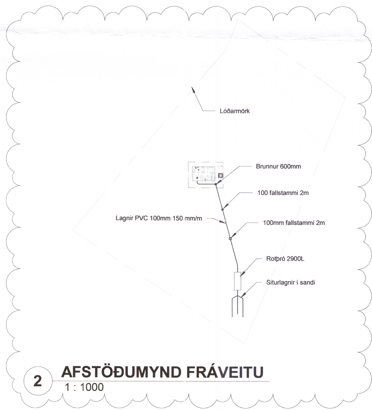
2 AFSTÖÐUMYND FRÁVEITU 1 : 1000

SKÝRINGAR: Allar lagnir skulu vera af viðurkenndri gerð nema annað sé tekið fram. Allt efni og frágangur skal vera í samræmi við holræsareglugerð og ÍST 68. Þegar gengið er frá stútum í gólf og veggjum skal passa að fella frárennslisstúta að málsettum stöðum. Öll rör að VS eru 100mm. Öll rör að HL eru 40mm. Öll rör að ST/GN eru 40mm. Ull niðurföll á baðrymum notast einnig sem öryggisniðurföll fyrir baðherbergið. Öll rör skulu vera Sil hjóðdempandi og á stamma skal setja að lámarki tvær festur á milli hæða.