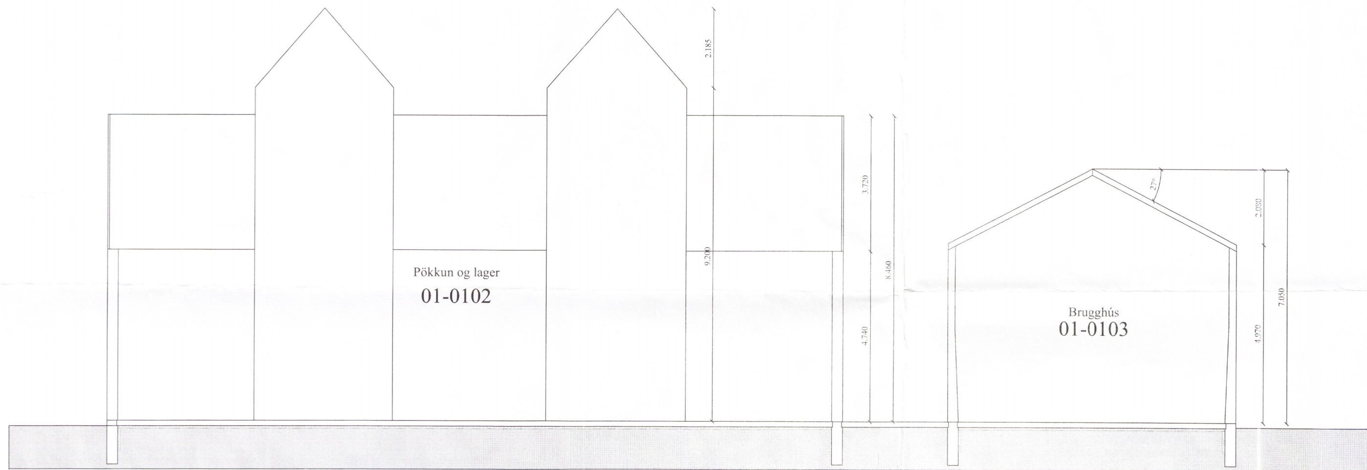
Snið B-B Mkv. 1:100