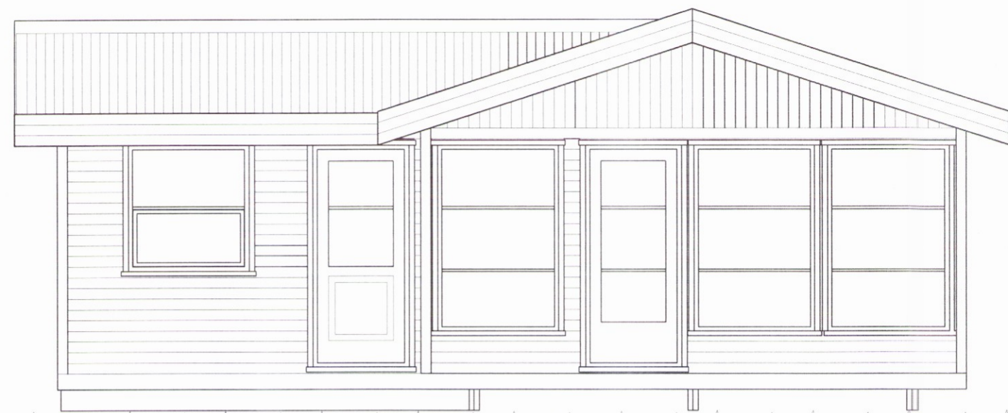
Viðbygging Eldri hluti SUÐLÆG HLIÐ