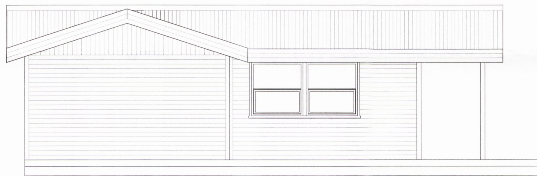
Viðbygging Eldri hluti VESTLÆG HLIÐ