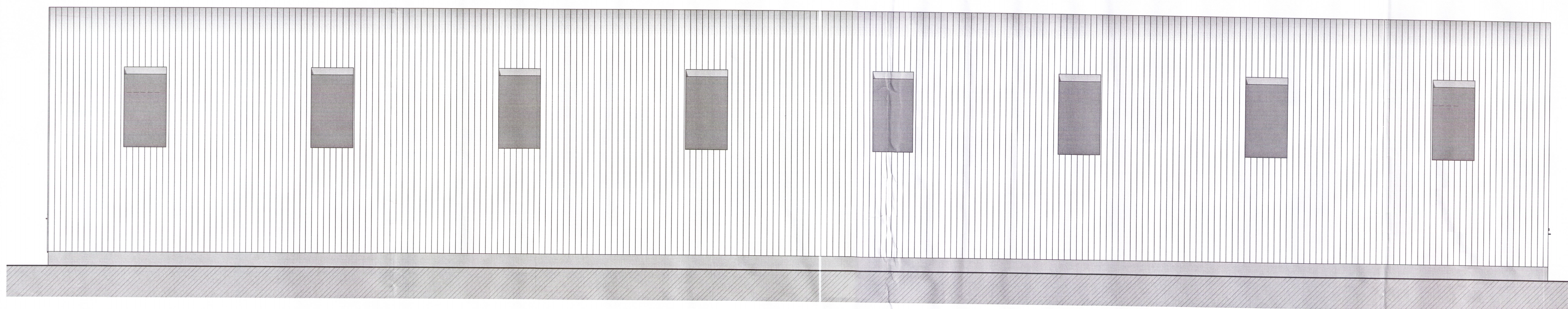
1 S-Austur VT 1 : 50