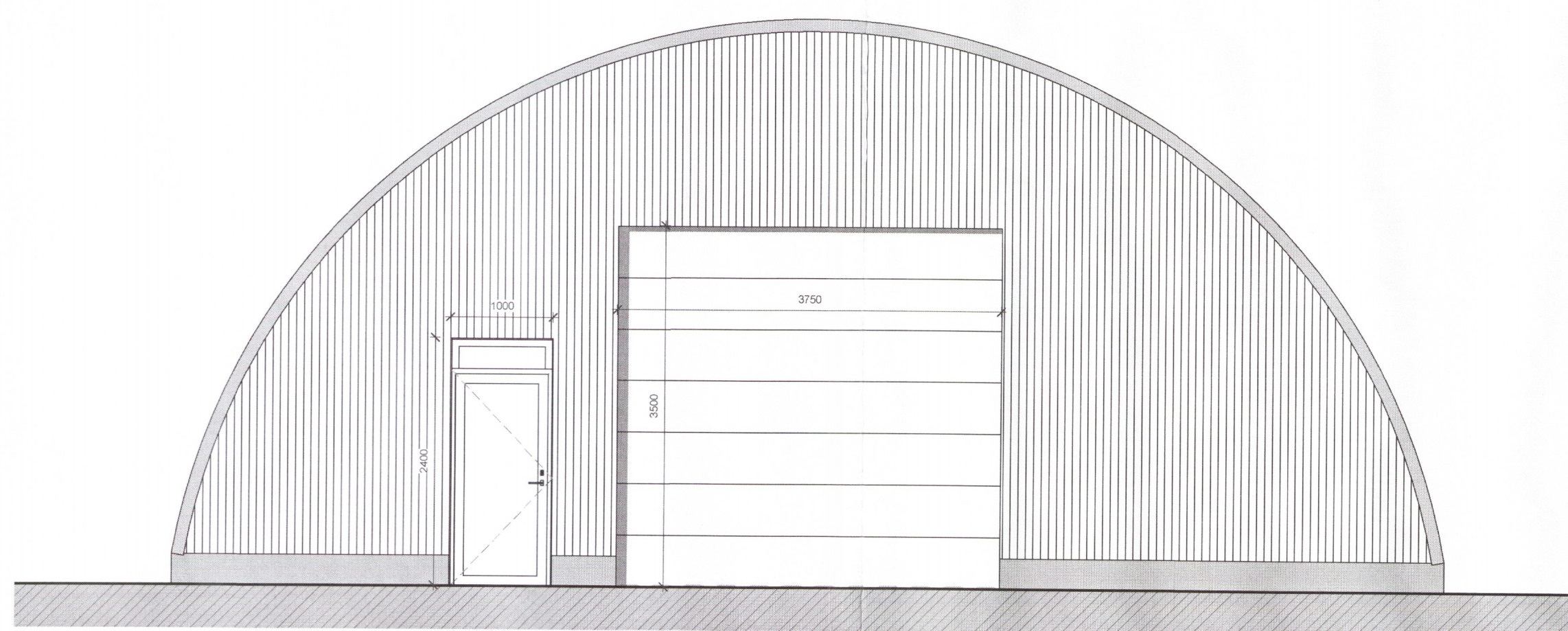
2 S-Vestur VT 1 : 50