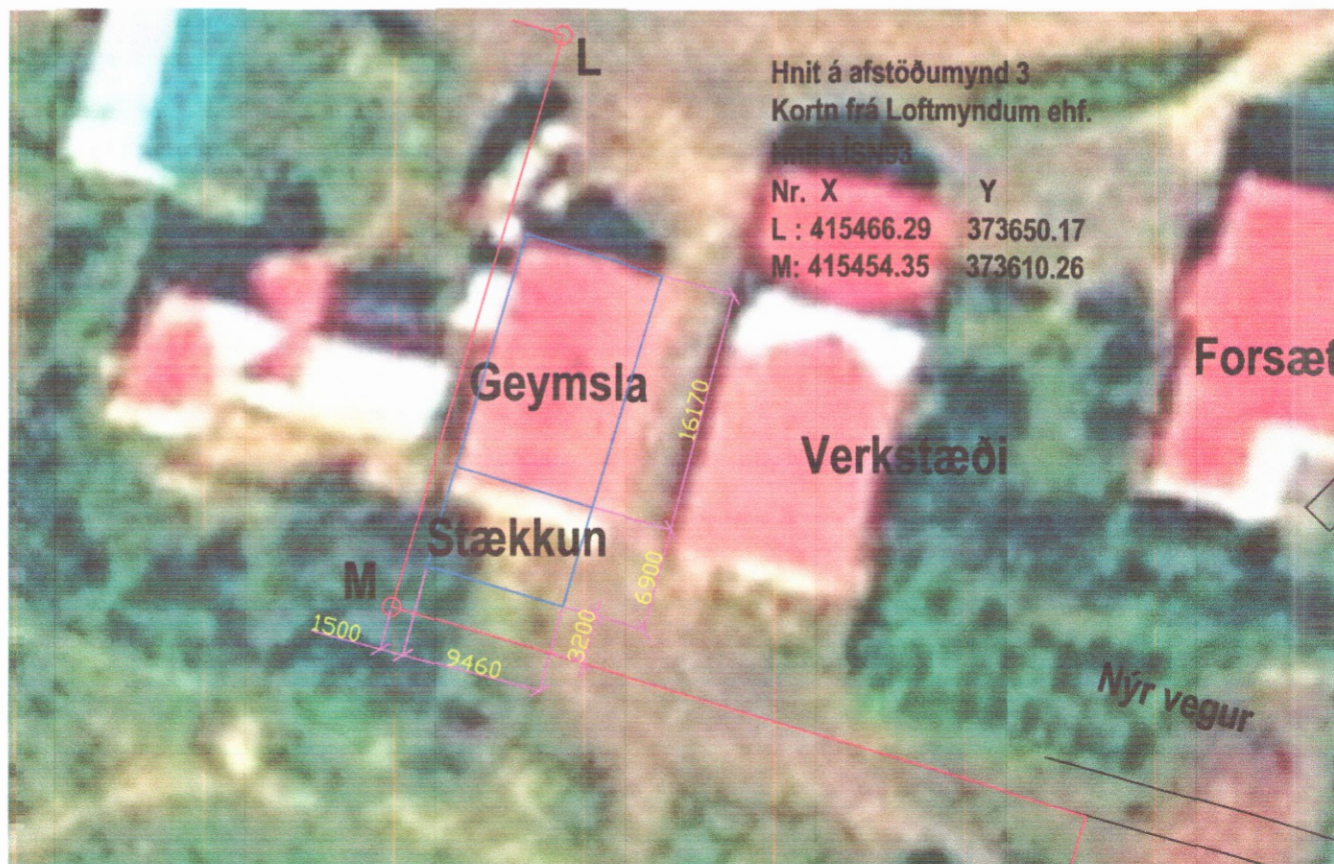
3 Afsstöðmynd 3 1:500