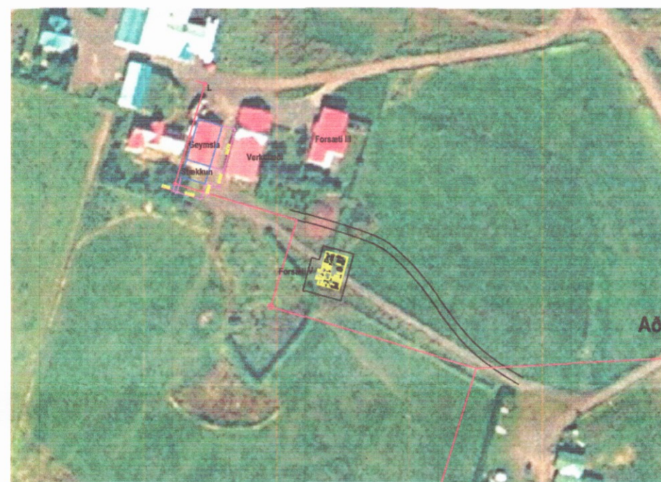
2 Afsstöðmynd 2 1:1.000