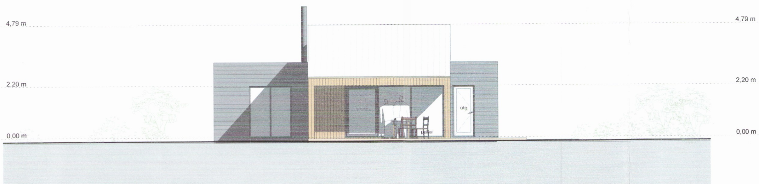
Útlit norður 1:100