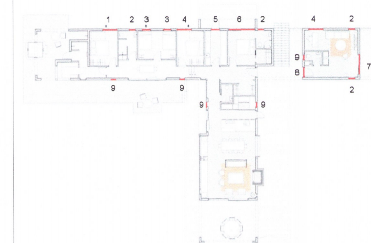
LOD200- Grunnmynd glugga yfirlits

ATH: Gler skal uppfylla kröfur RB nr. 112/2012 um öryggisglær. Við val á glergerðum skal fylgja Rb-bláðum Nýsköpunarmiðstöðvar Íslands (31)121.1 "Val um gler gerða fyrir byggingar sem almenningur hefur aðgang að".