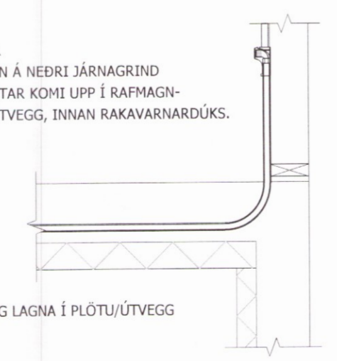
STAÐSETNING LAGNA Í PLÖTU/ÚTVEGG Mkv. 1:20

RÖR Í RÖR LÖGD OFAN Á NEDRI JÁRNAGRIND TENGIKISTÚTAR KOMI UPP Í RAFMAGN- GRIND Í ÚTVEGG, INNAN RAKAVARNARÐÚKS.