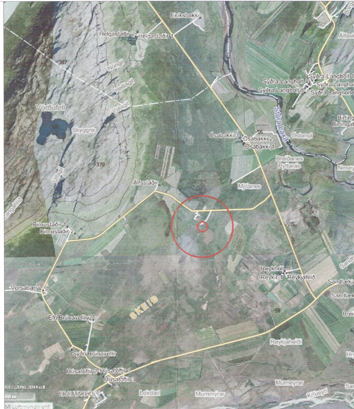
Yfirlitsmynd (ekki í mælikvarða)