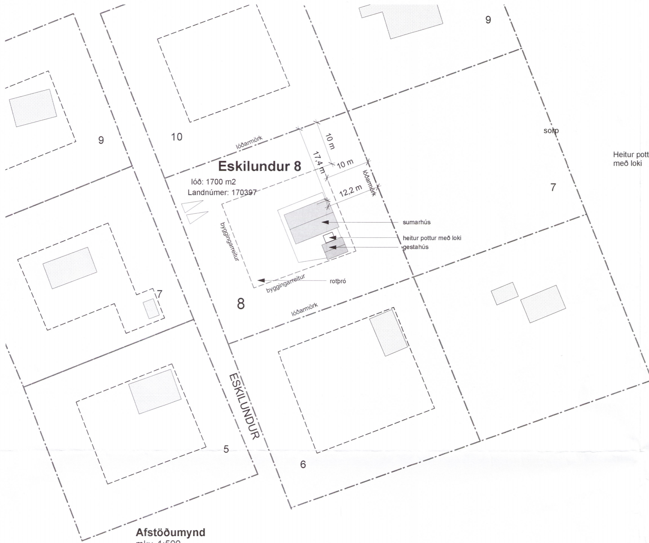
Afstöðumynd mkv. 1:500