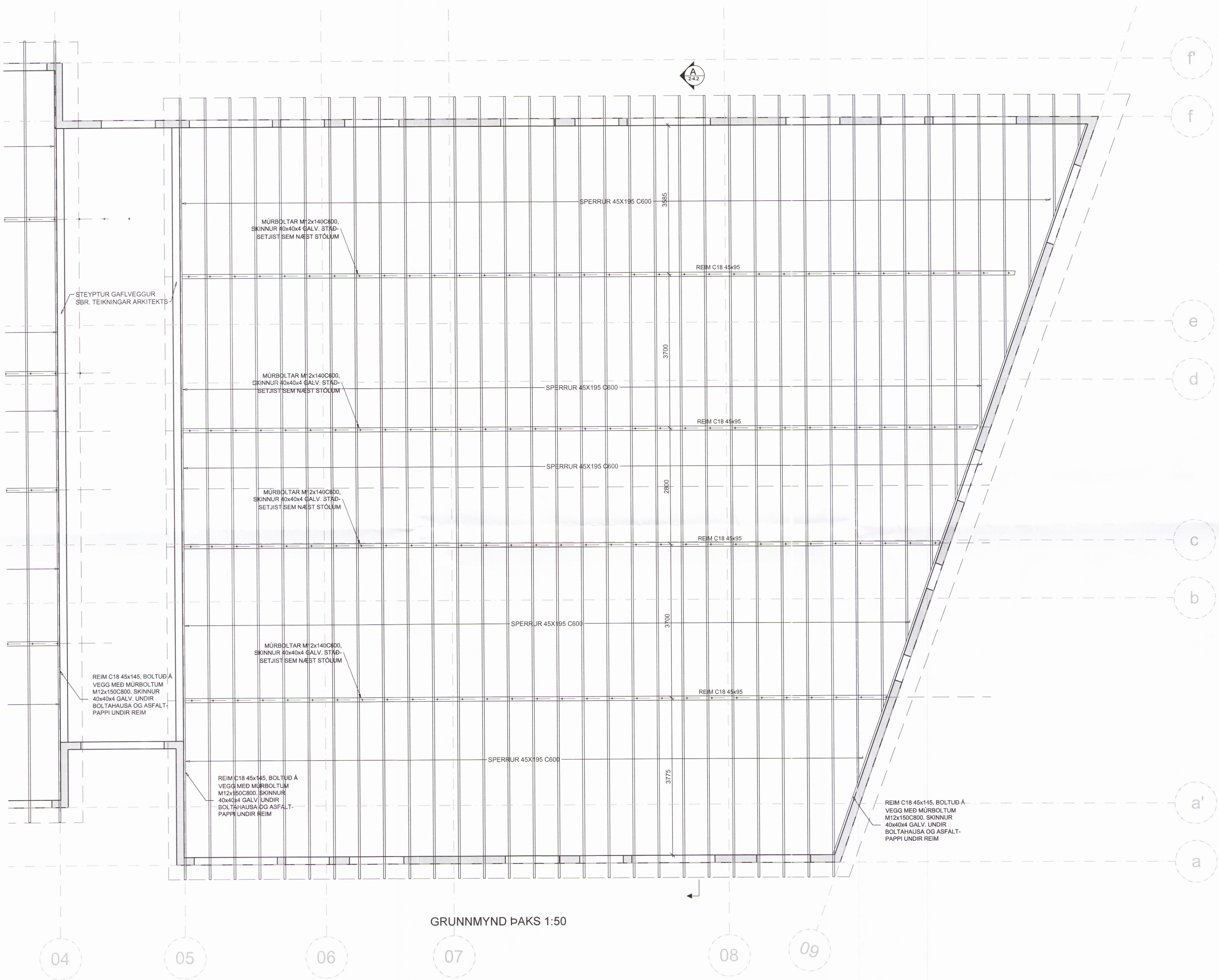
GRUNNMYND ÞAKS 1:50