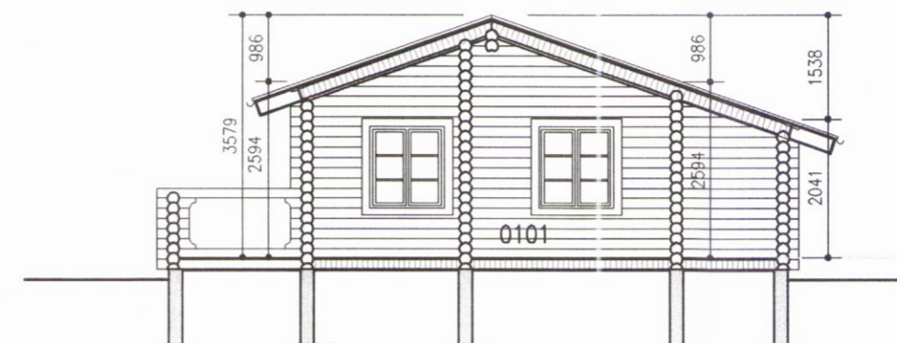
SNID 1-1 1:100