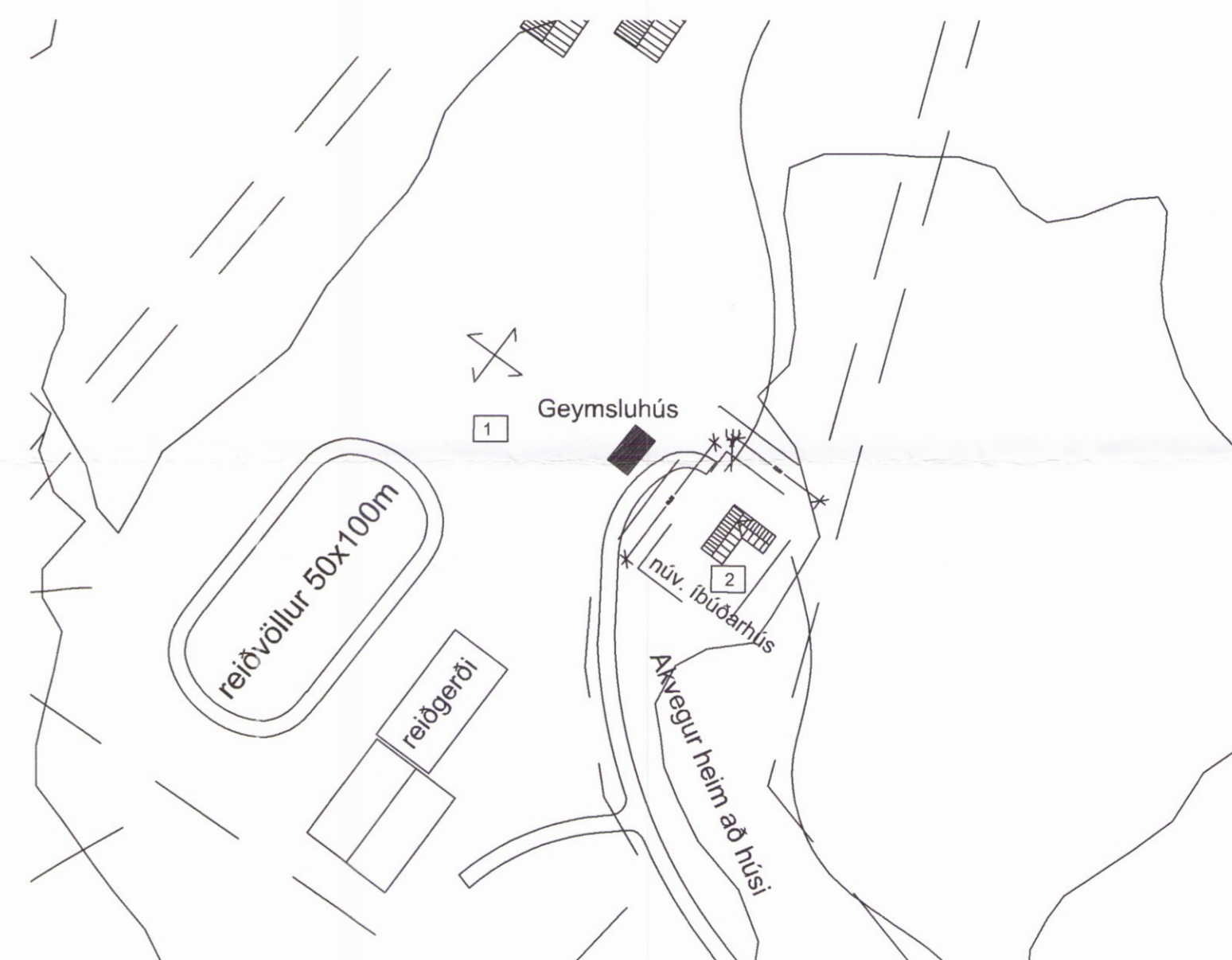
Afstöðumynd. mk. 1:500